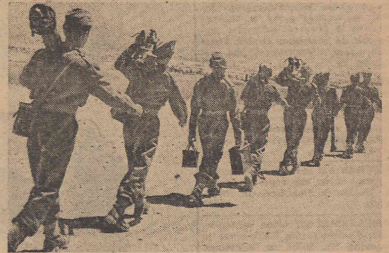
Świeżo przeszkolone pod kierownictwem brytyjskich oficerów oddziały greckie udają się na front, by walczyć przeciwko powstańcom.

Harcerze z całym rynsztunkiem obozowym udali się na teren pow. Jelenia Góra, gdzie mają spędzić miesiąc czasu.