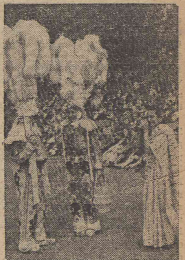
Gość z Bombaju, S. Merta, robi zdjęcie dwójce tancerzy belgijskich w Hyde Parku, członków T-wa tancerzkiego „Gilles de Binche“ na międzynarodowym festiwalu tańców ludowych, urządzonym przez przewodników i harcerzy różnych narodowości.