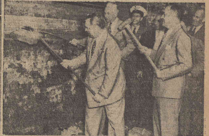
Burmistrz Nowego Jorku O. Dywer pomaga w pracy przy burzeniu starej budowli na miejscu której ma być wzniesiony nowy wspólny gmach, który stanie się siedzibą O. N. Z.