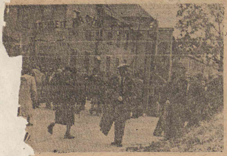
do obozu w Oświęcimiu, gdzie urządzono obecnie Muzeum Martyrologii. Nad bramą widnieje napis „Arbeit macht frei”.