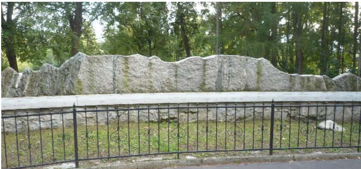
Śnieżka -widoczny najwyższy szczyt