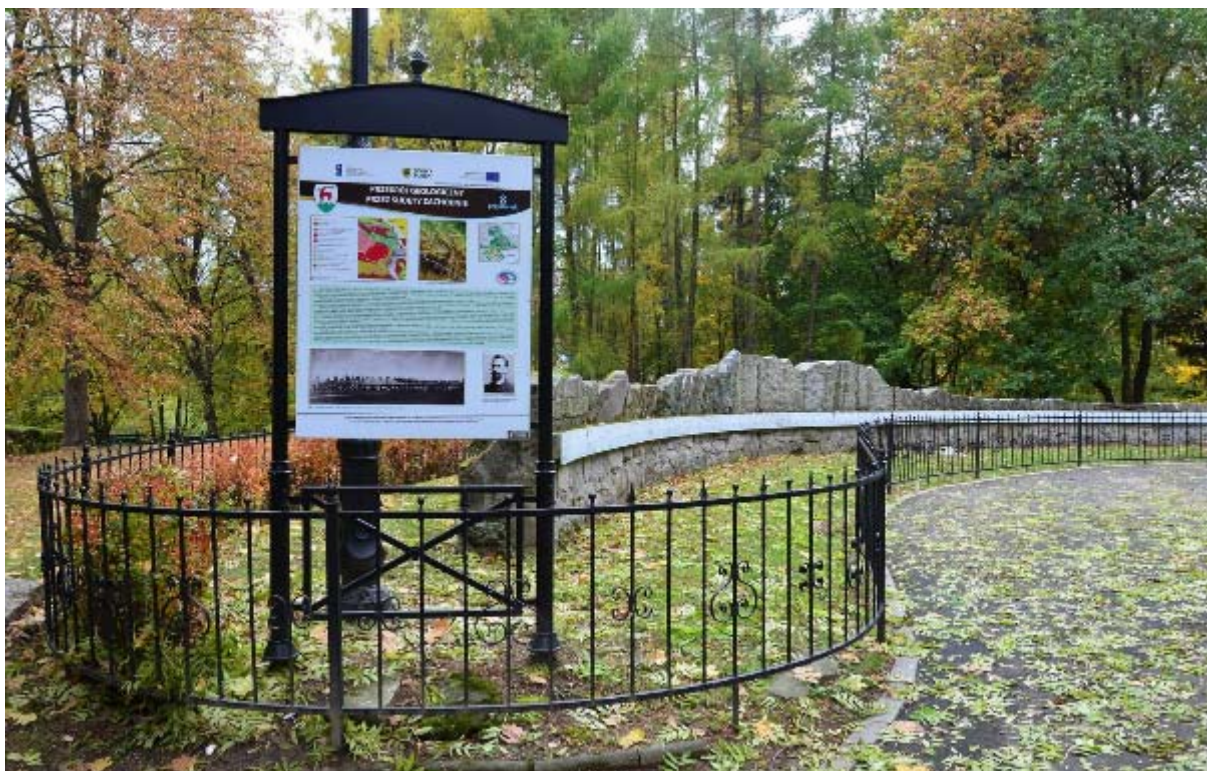
Tablica informacyjna i profil górski