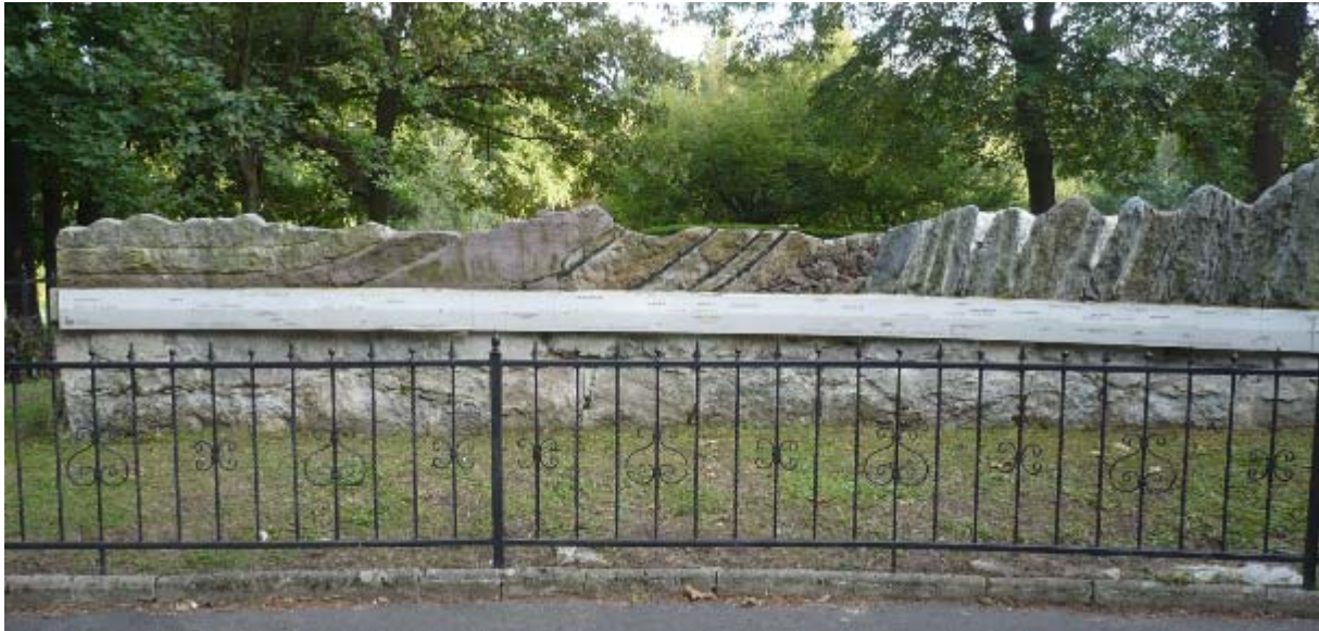
Przekrój geologiczny Karkonoszy