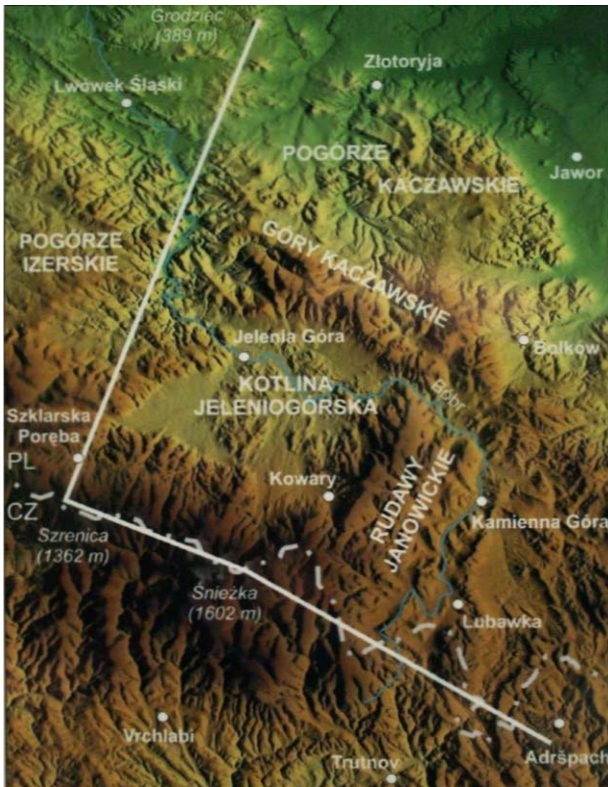
Widok na przekrój profilu skalnego