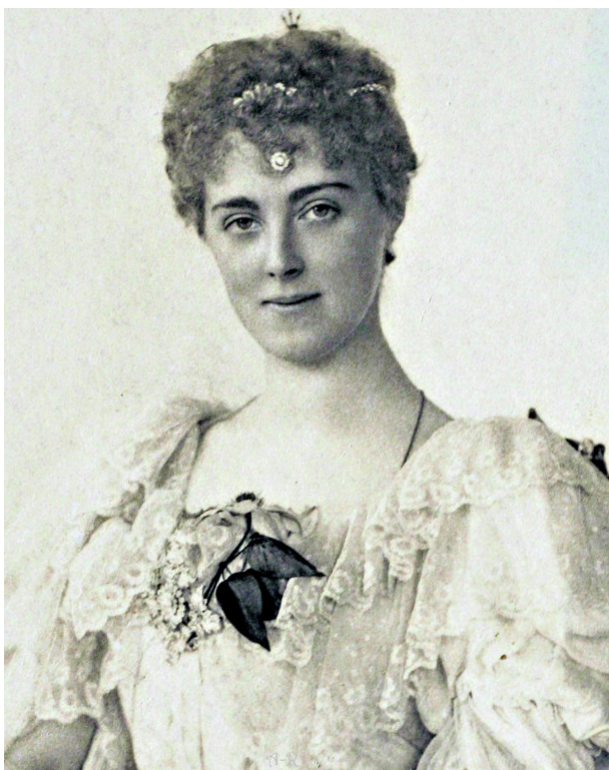
Księżna Daisy von Pless - 1900

-W pretensjonalnym świecie była najmniej snobistyczną osobą, jaką kiedykolwiek znałem; w okrutnej rzeczywistości jaśniała radością i uprzejmością. Miała na świecie tylko jednego wroga – samotność, która ją w końcu pokonała- tak o księżnej Daisy, która zmarła dzień po swoich 70 urodzinach, 29 czerwca 1943 roku w Wałbrzychu, pisał angielski dyplomata i pisarz Harold Nicolson. Opinię tę przedstawił na łamach The Spectator z 22 lipca 1943, kiedy na Wyspy Brytyjskie dotarła