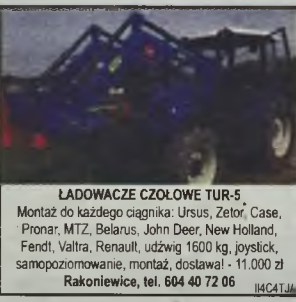
LADOWACZE CZOŁOWE TUR-5 Montaż do każdego ciągnika: Ursus, Zetor, Case, Pronar, MTZ, Belarus, John Deer, New Holland, Fendt, Valtra, Renault, udźwig 1600 kg, joystick, samopoziomowanie, montaż, dostawa! - 11.000 zł Rakoniewice, tel. 604 40 72 06 I14C4TJH

ALFA ROMEO 147, 2005 r., 1600 ccm, benz., sprow., bogate wyposaż., zadbane, l. właśc. - 11.800 zł. Wieruszów, tel. 509/22-18-70 JG0502144