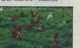
ROczne KURY NIOSKI Z WOLNEGO WYBIEGU różne kolory: czerwone z czarną szyjką, czarne z żółtą szyjką, białe z czarną szyjką i biało-czarne nakrapiane, znoszą duże jajka - 15 zł Bystrzyca Dolna, Świdnica, tel. 74 852 43 23

AUDI A4 KOMBI, 1997 r., 1900 ccm, TDI, 110 KM, l. właśc. w kraju, wspom. kierownicy, c. zamek, ABS, roleta, relingi dach., podgrz. fotele, el. szyby, el. lusterka, klimatronic, airbagi, ważny przegląd - 7.900 zł lub zamienię. Kłodzko, tel. 603/74-62-58, 74/868-45-51 JG0551504