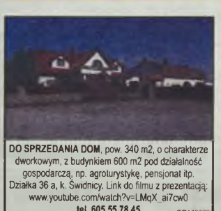
DO SPRZEDANIA DOM , pow. 340 m2, o charakterze dworowym, z budynkiem 600 m2 pod działalność gospodarczą, np. agrolistwisko, pensjonat itp. Działka 36 a, k. Świdnica, Link do filmu z prezentacją: www.youtube.com/watch?v=L1MqX_a17cw0 tel. 605 55 78 45 OR14B121