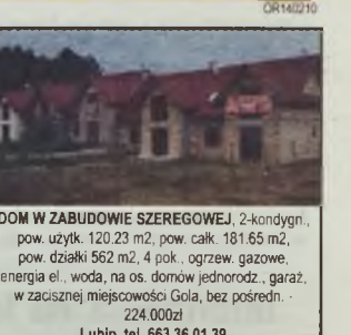
DOM W ZABUDOWIE SZEREGOWEJ , 2-kondygn., pow. użytk. 120,23 m2, pow. całkow. 181,65 m2, pow. działki 562 m2, 4 pok. ogrzew. gazowe, energia el., woda, na os. domów jednorodn., garaż, w zacisznej miejscowości Gola, bez pośredn. - 224.000zł Lubin, tel. 663 36 01 39 I14C7EYH

AUDI A3 AVANT, 2008 r., 126 tys. km, 2000 ccm, TDI, czarny met., klimatronic 2-strefowy, wspomaganie kierownicy, 6 airbagów, 4 el. szyby, alufelgi, c. zamek, skórzana tapicerka alcantara - 32.400 zł lub zamienię na inny z dopłatą do 10.000 zł. Nysa, tel. 882/22-20-85 G149CNYC