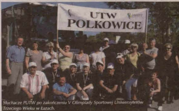
Słuchacze PUTW po zakończeniu V Olimpiady Sportowej Uniwersytetów Trzeciego Wieku w Łazach.