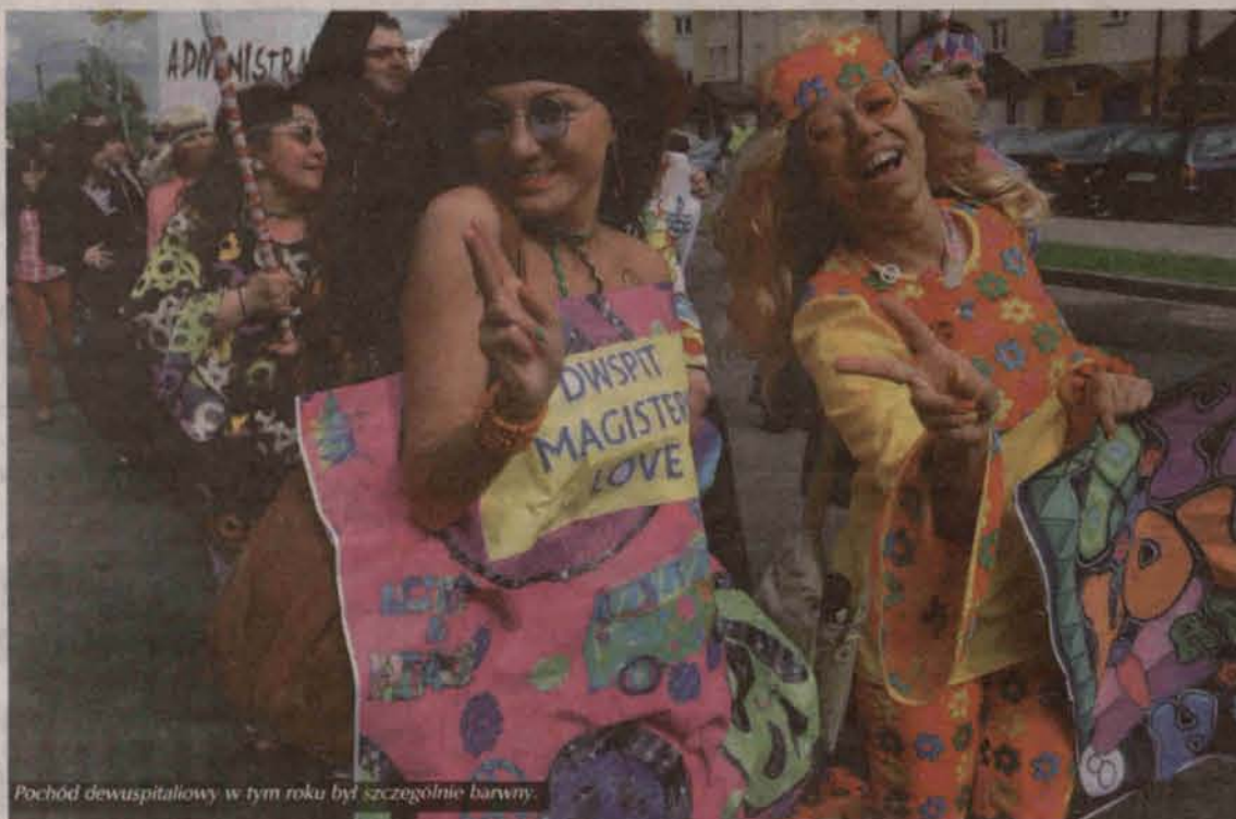
Pochód dewuspitaliowy w tym roku był szczególnie barwny.

Hitem tegorocznych Dewuspitaliów okazał się korowód studencki ulicami Polkowic, połączony z paradą