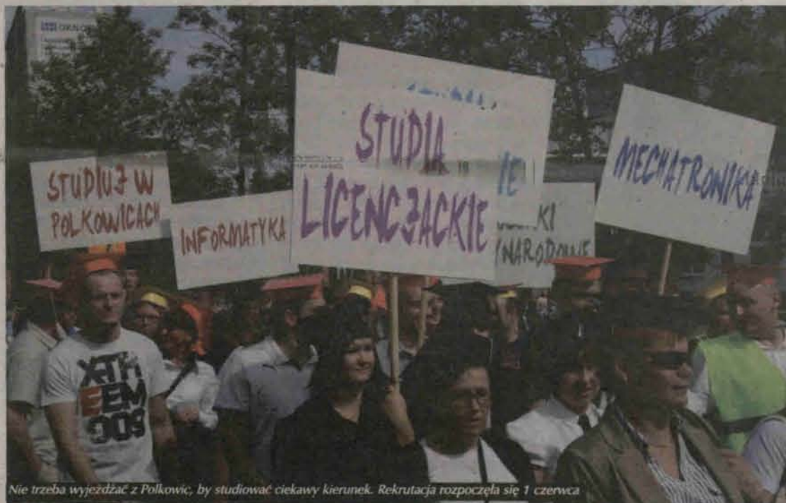
Nie trzeba wyjeżdżać z Polkowic, by studiować ciekawy kierunek. Rekrutacja rozpoczęła się 1 czerwca

Tegoroczna rekrutacja na studia w DWSPiT jest wyjątkowa, ponieważ po raz pierwszy w historii polkowskiej uczelni w ofercie znalazły się studia II stopnia, czyli studia magisterskie. Jak dotąd, w poprzednich latach nabór prowadzony był na studia licencjackie I stopnia: stosunki międzynarodowe i administrację oraz studia inżynierskie: mechatronikę oraz informatykę. Na te kierunki nabór trwa także w tym roku. Obecnie wniosek o uruchomienie studiów magisterskich w Polkowicach