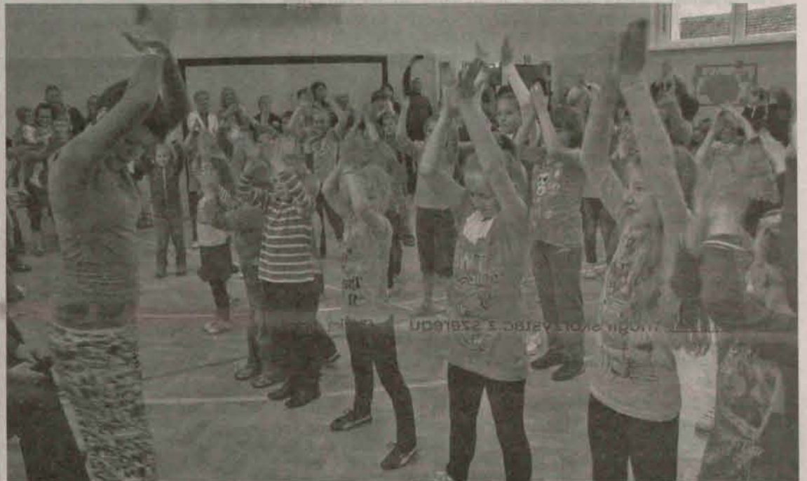
Lubin przeprowadzili warsztaty siatkarskie.

Na zakończenie festynu zawodnicy pierwszoligowego Cuprum Mundo