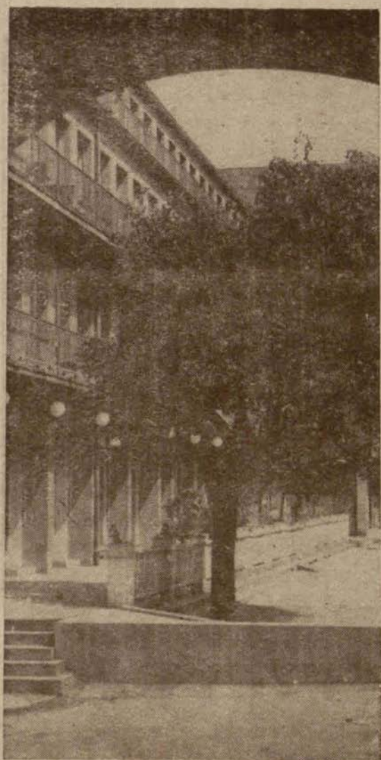
Sanatorium Nr 1 cieplickiego uzdrowiska — na zapleczu tego budynku mieści się Zakład Kąpielowy — serce „Zdroju”