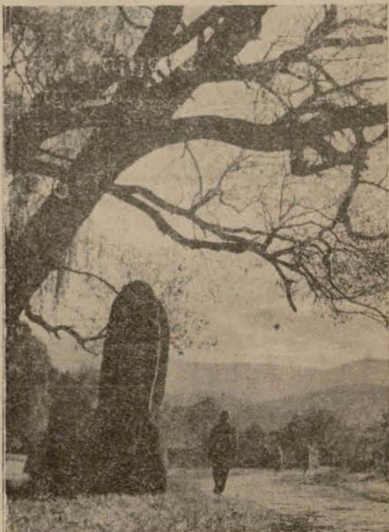
Pamiętkowy glaz w Parku Norweskim upamiętniający spotkanie W. Pola i K. Ujejskiego w Cieplicach w 1847 r.

W sąsiedztwie Placu Piastowskiego mieszczą się główne pawilony sanatoryjne: „Lalka”, „Polonia”, „Snieżka” (sanatorium resortowe), „Stary Zdrój” oraz połączone z zakładem kąpielowym Sanatorium I z wmurowaną tablicą, informującą iż „Zdrój” jest fundacją piastowską (w 1281 r. książę piastowski Bernard ze Lwówka nadał zakonowi joannitów ziemię i ciepłe źródła dla wykorzystania w celach leczniczych). Od ul. Kościelnej — wejście do pijalni zdrojowej (4 źródła siarkowe).