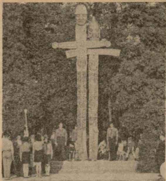
Pomnik „Cześć i Chwała Oręża Polskiego” — modrzewiowe miecze wykonane w czynie spo- łecznym — nagrodzone przez Ministra Obrony w 1970 r.

czytach, prelekcjach z przeżroczami lub kon- kursami, spotkaniach itp.