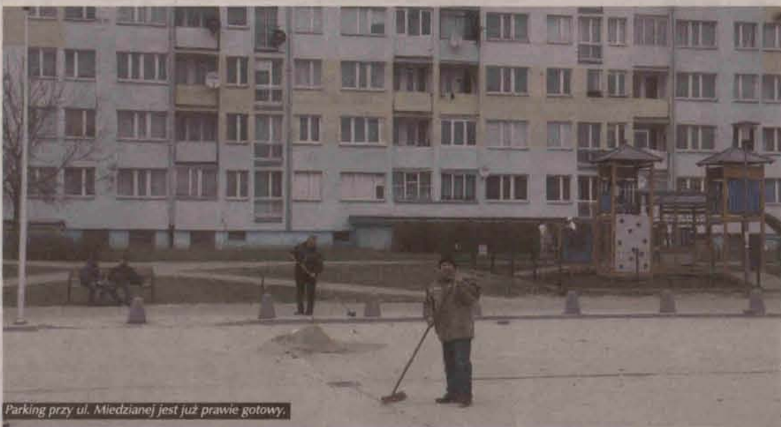
Parking przy ul. Miedzianej jest już prawie gotowy.

Do końca tego roku przybędzie w naszym mieście ok. pół tysiąca nowych miejsc, na których będziemy mogli zaparkować swoje samochody. Już w kwietniu 70 takich miejsc udostępnią parkingi pomiędzy deptakiem przy ul. Miedzianej a ul. Dąbrowskiego.