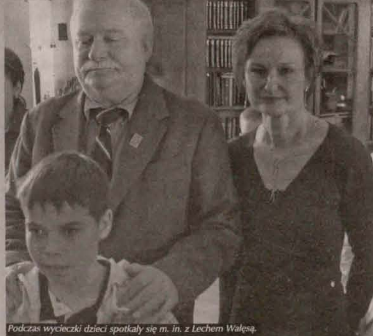
Podczas wycieczki dzieci spotkały się m. in. z Lechem Wałęsą.

Wycieczka mogła dojść do skutku dzięki pomocy finansowej Gminy Pol-