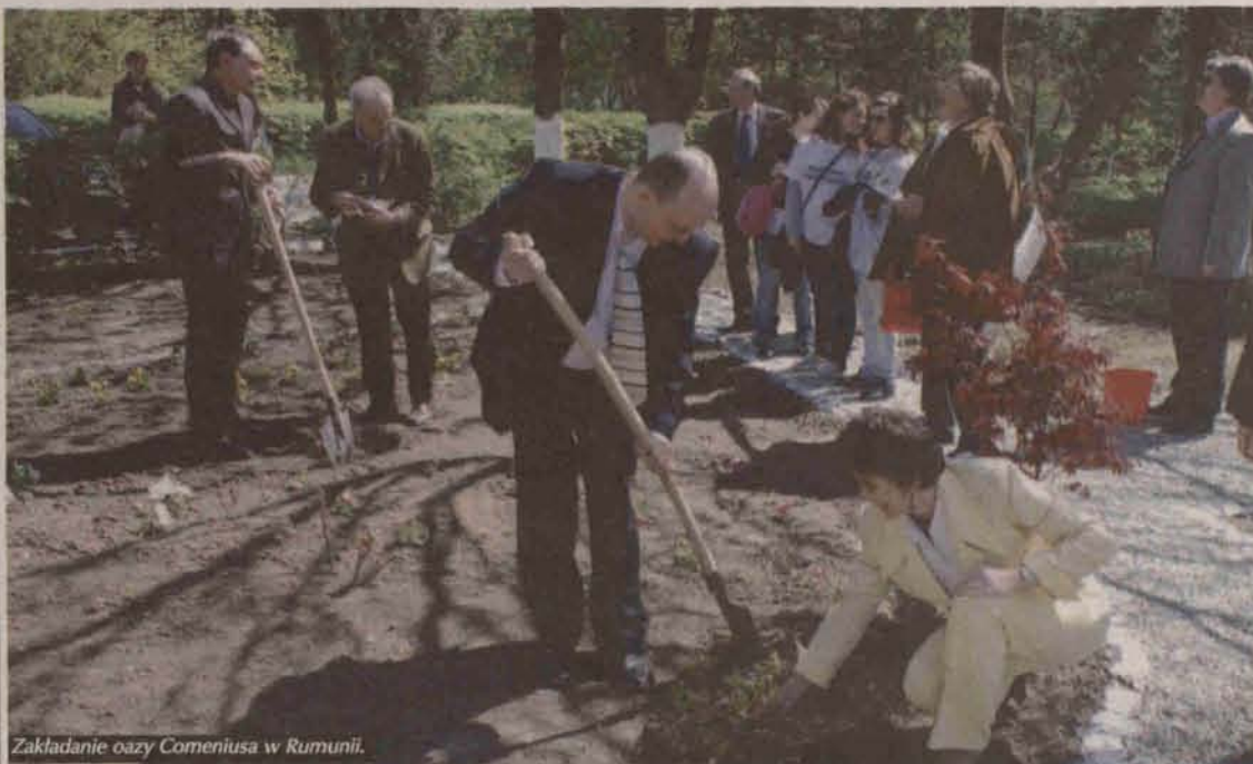
Zakładanie oazy Comeniusa w Rumunii.

Odpowiedzi na tytułowe pytanie szukali przez dwa lata uczniowie z pięciu krajów Europy, w tym polkowickiego Zespołu Szkół. Podsumowaniem projektu "Quo vadis Homo sapiens?" był Polkowicki Festiwal Ziemi zwieńczony międzynarodową konferencją.