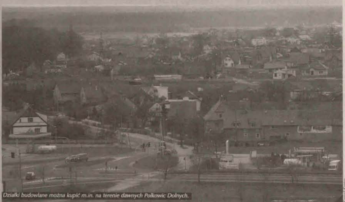
Działki budowlane można kupić m.in. na terenie dawnych Polkowic Dolnych.

Należy też zwrócić uwagę na granice działki. Między nie zawsze jest zgodna z faktycznym przebiegiem granicy. Uprawnio-