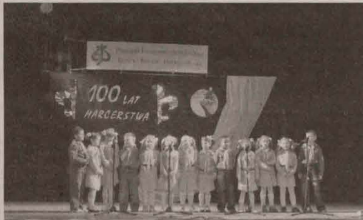
Występ zuchów z polkowickiego hufca ZHP na scenie Zespołu Szkół.

Najbardziej rozśpiewaną gromadą zuchową okazała się 11.8 GZ "Szalone Dzieciaki" z hufca we Wrocławiu, a w kategorii zespołów wokalnych 13 DW "Wagabunda" ze Zgorzelca.