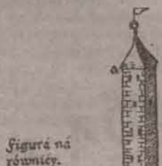
Figura na równicy.

Planika mieć proporcya. A tak iako jest Linea f. d. naprzeciwko Linicy d. e. tak też jest Linea f. c. naprzeciwko Linicy c. b.