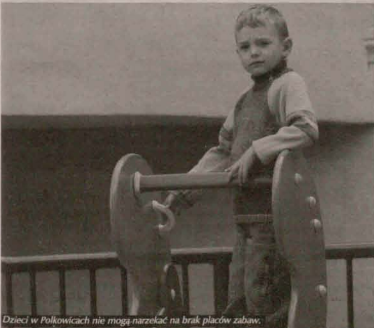
Dzieci w Polkowicach nie mogą narzekać na brak placów zabaw.

Dwa ciekawe urządzenia zabawowe dla maluchów zakupi gmina Polkowice i zamontuje w sercu miasta. To kolejna atrakcja dla najmłodszych mieszkańców gminy, w której niebywale wysoka jest ilość placów zabaw.