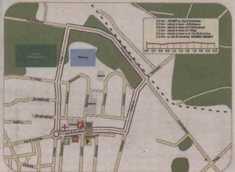
Polkowice CAŁA POLSKA NA ROWERY - POLKOWICE, 30.05.2010, ULICA KARDYNAŁA KOMINKA, START - GODZ. 14