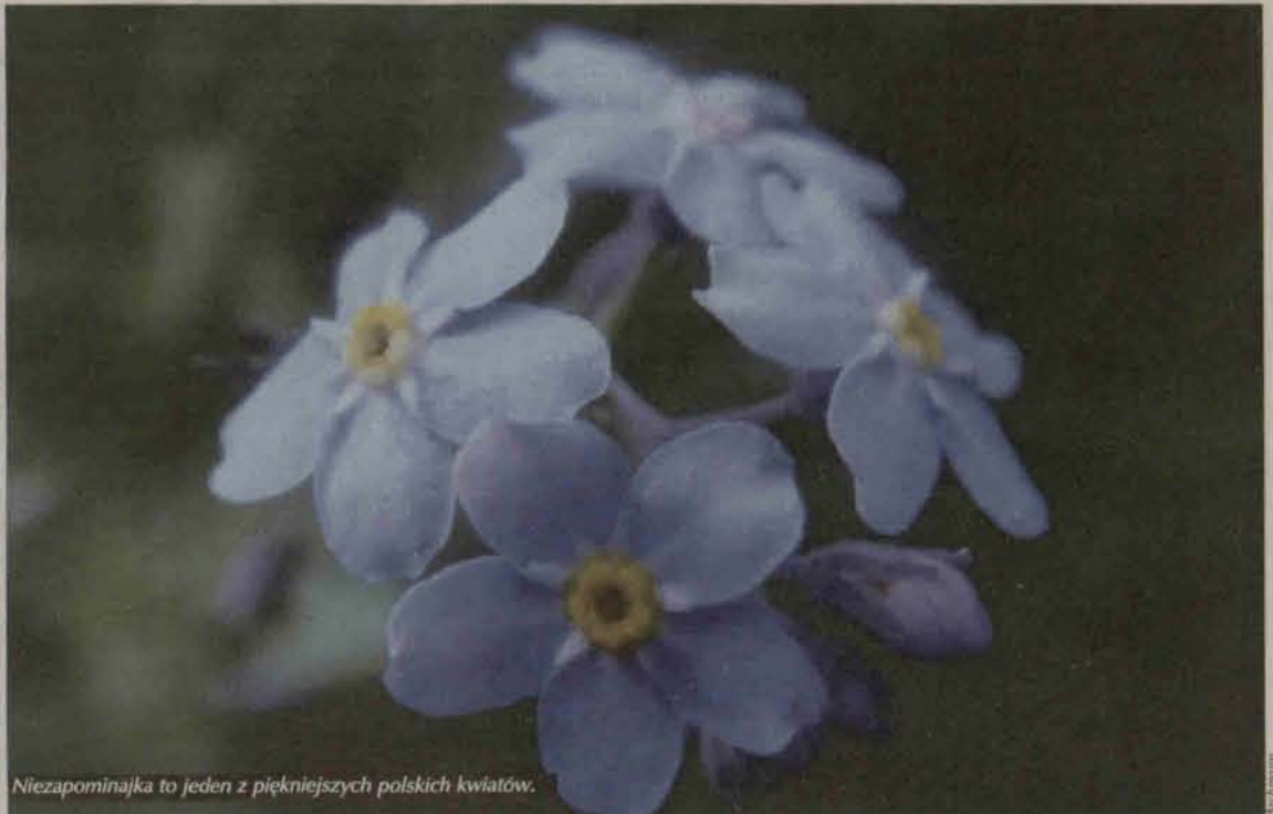
Niezapominajka to jeden z piękniejszych polskich kwiatów.

Rondo przy ulicach Dąbrowskiego i 3 Maja nosi imię Polskiej Niezapominajki. To efekt inicjatywy podjętej przez polkowickie dzieci oraz Stowarzyszenie Animacji Twórczej i Działań Alternatywnych.