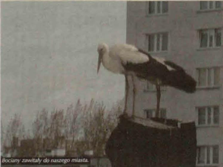
Bociany zawitały do naszego miasta.