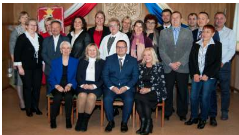
(fotografia z 20.11.2018 roku)