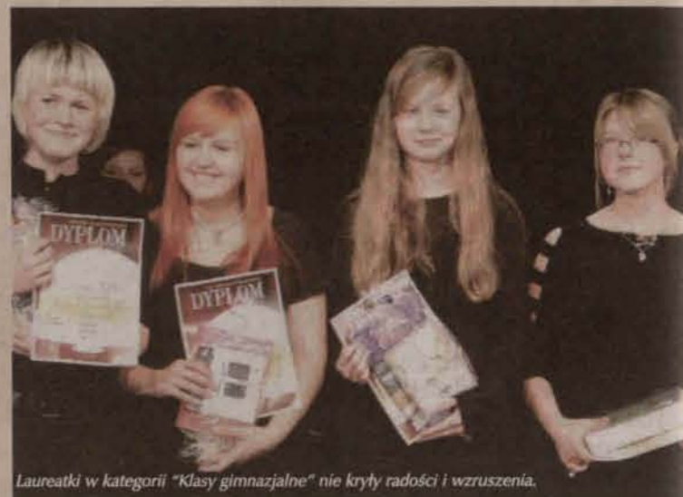
Laureatki w kategorii "Klasy gimnazjalne" nie kryły radości i wzruszenia.

- Ważne jednak, że ze spadkiem ilości nie nastąpił spadek jakości, bo duża część recytacji była naprawdę bardzo przekonująca. W związku z tym wskazanie tych najlepszych było dla nas nie lada wyzwaniem - dodał Brawer.