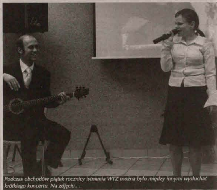
Podczas obchodów piętek rocznicy istnienia WTZ można było między innymi wysłuchać krótkiego koncertu. Na zdjęciu.....