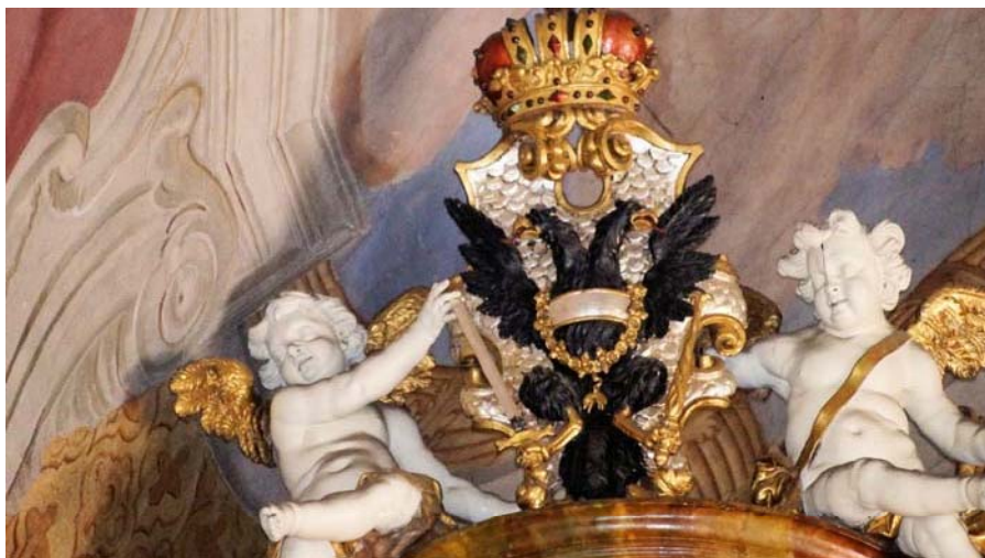
Habsburski dwugłowy orzeł z Orderem Złotego Runa i herbowymi barwami Austrii na piersi