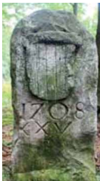
Herb rodu Schaffgotsch