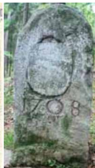
Herb krzeszowski z mitrą