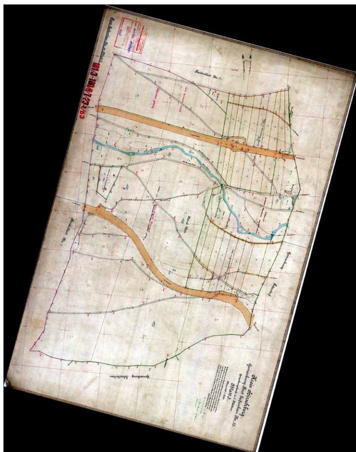
Mapa katastralna Mniszego Lasu

jego granic. Las Mönchswald ukazują również mapy Messtischblatt i mapy turystyczne, jednakże bez konturu jego granic.