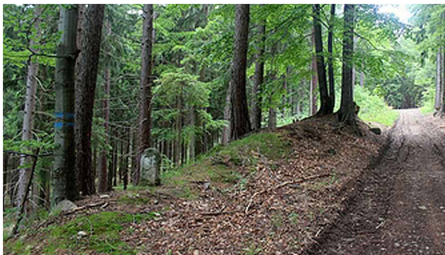
Kamień graniczny Nr 25 przy drodze w Mniszym Lesie

W krzeszowskim archiwum klasztornym udało się odnaleźć mapę parceli leśnych nad potokiem Kamienną z 1701 roku, która jest cennym uzupełnieniem informacji zawartych w dokumentach czy też księgach fundacyjnych, a także opatrzona jest opisem. Powierzchnia Mniszego Lasu to 542 morgi i 40 prętów kwadratowych (patrz Bergemann – Geschichte von Warmbrunn, strona 203). Także na mapie leśnej Szklarskiej Poręby z 1881 roku oraz na mapie leśnictwa Kopaniec z 1905 roku odnajdujemy las Mönchswald wraz z konturami