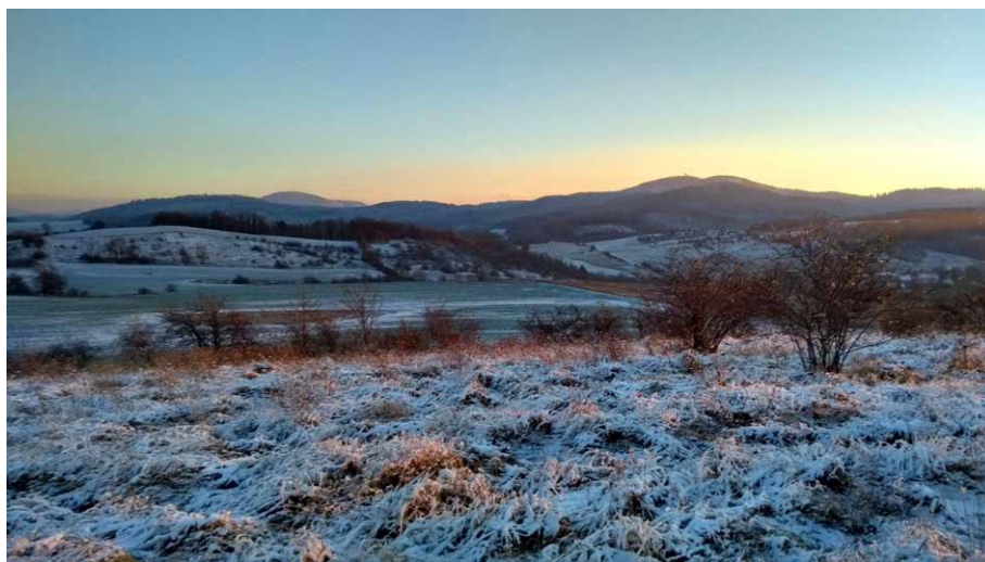
Chełmiec i Trójgarb przed zachodem słońca