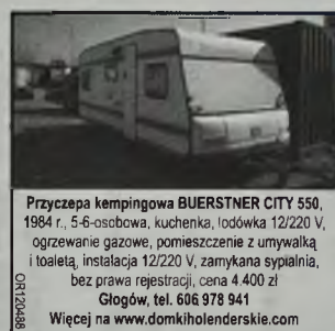
Przyczepa kempingowa BUERSTNER CITY 550 , 1984 r., 5-6-osobowa, kuchenka, lodówka 12/220 V, ogrzewanie gazowe, pomieszczenie z umywalką i toaletą, instalacja 12/220 V, zamknięta sypialnia, bez prawa rejestracji, cena 4.400 zł Głogów, tel. 606 978 941 Więcej na www.domkholenderskie.com

PRZYCZĘPA KEMPINGOWA GRUAU , 1989 r., lekka, WC z umywalką, radio, telewizor, antena satelitarna, ogrzewanie, gotowa do użytkowania, zarejestr. bezterminowo - 4.600 zł. Bielany Wrocławskie, tel. 888/64-30-53, 727/23-76-45 G13CXJXY