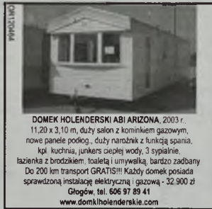
DOMEK HOLENDERSKI ABI ARIZONA , 2003 r., 11,20 x 3,10 m, duży salon z kominkiem gazowym, nowe panele podłog., duży narożnik z funkcją spania, kpl. kuchnia, juchers ciepłej wody, 3 sypialnie, łazienka z brodzikiem, toaleta i umywalką, bardzo zadbane Do 200 km transport GRATIS!!! Każdy domek posiada sprawdzoną instalację elektryczną! gazowa - 32.900 zł Głogów, tel. 606 97 89 41 www.domkholenderskie.com

PRZYCZĘPA KEMPINGOWA , 1980 r., 3, 4-osobowa, aneks kuchenny, 2 osobne łóżka, ogrzewanie, dużo schowków, uchylne okna, 1-osiova, sprawdzona, bez prawa rejestracji, idealna na działkę lub budowę, możli. transport - 2.100 zł inne. Skokowa, powiat trzebnicki, tel. 692/20-04-11 JG0633103