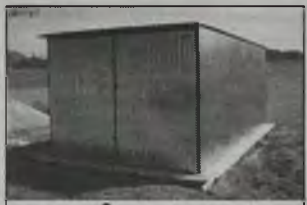
FOTO GARAŻ , Czernica Wrocławska, blok, pow. 25 m 2 , ks. wieczysta, mury, w zabudowie szeregowej, z dachem dwuspadowym (działka pod garaż - 49 m 2 ), z możliwością zrobienia strychu, podłączenia prądu i wody, teren niezagrożony powodzią - 21.000 zł. Czernica, tel. 609/15-00-11 bboch99@gmail.com I13F4MAW