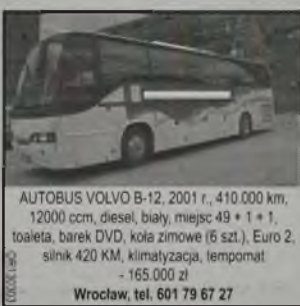
AUTOBUS VOLVO B-12, 2001 r., 410.000 km, 12000 ccm, diesel, biały, miejsc 49 + 1 + 1, toaleta, barek DVD, koła zimowe (6 szt.), Euro 2, silnik 420 KM, klimatyzacja, tempomat - 165.000 zł Wrocław, tel. 601 79 67 27

AUTOBUS TOYOTA CAETANO OPTIMA IV, 1997 r., 386 tys. km, 4100 ccm, 136 KM, diesel, biały, 26 miejsc siedz. + kier., drzwi otwierane automatycznie, indywidualne nawiewy i oświetlenie, fotele reg. i rozkładane, nagłośnienie radio + mikrofon, ABS, klimat., wspom. kier., webasto, tachograf, lodowka, 5-bieg, bez wypadku, 1 właściciel, zarejestr. - 50.900 zł. www.rbus.autogielda.pl. Wojcieszów, powiat zlotoryjski, tel. 603/77-93-93, 605/62-70-21 JG0118673