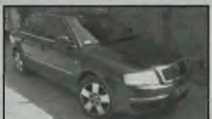
SKODA SUPERB PLATINUM SEDAN, 2004 r., 320.000 km, 1.9 D, 130 KM, czarny met., klimat., fotele skórzane podgrz., alufelgi, dodatkowo 4 kółka zimowe, rekl. bixenonowe, el. szyby i lust., manualna skrzynia biegów - 18.000 zł Wrocław, tel. 601 79 67 27 OR130352

SKODA OCTAVIA SEDAN , 2010 r., 1600 ccm, benz., inst. gaz., perlowniczy, oryg. inst. gaz., 5-osobowy, bez wypadku, I właśc., z salonu w kraju, klimatronic, c. zamek, alarm, ABS, ASR, el. szyby - 29.500 zł. Wrocław, tel. 71/316-84-69, 609/02-75-07 JG0525413