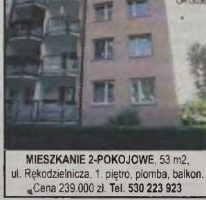
MIESZKANIE 2-POKOJOWE , 53 m2, ul. Rękodzielnicza, 1. piętro, piombka, balkon. Cena 239.000 zł. Tel. 530 223 923

ALFA ROMEO 147 , 2004 r., 83 tys. km, 2000 ccm, Twin Spark, 16V, jasnoniebieski metalik, 5-drzwiowy hatchback, skórzana tapicerka, klimatronic, el. szyby, el. lusterka, c. zamek + 2 kluczyki, oryg. aluminiowe felgi z oponami letnimi, kpl. kół zimowych, sprow. z Niemiec, ks. serwisowa, do zarejestrowania - 15.900 zł. Strzelin, tel. 604/78-71-52 GI3ANWFK ALFA ROMEO 147 , 2004 r., 217 tys. km, 1900 ccm, JTD, 115 KM, jasnoniebieski met., 5-drzwiowy, klimat., el. szyby, el. lusterka, ABS, TC, 6 airbagów, wspom. kierownicy, immob., c. zamek, halogeny - 9.900 zł + opłaty. Sulechów, powiat zielonogórski, tel. 605/21-46-16 GI3E7JCK