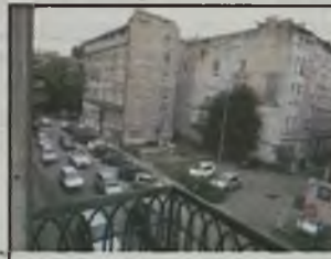
MIESZKANIE 2-POKOJOWE , 50 m2, ul. Stawowa, 2. piętro, balkon, CO miejskie. Cena 249.000 zł. Tel. 730 589 638

ALFA ROMEO 145 , 1999 r., 300 tys. km, 2000 ccm, 2-drzw. - 34.000 zł. Wrocław, tel. 33/223-32-21 dignasiak@autogiolda.pl I13E73C7 ALFA ROMEO 147 , 2002 r., szary met., skórzana tap., pełne wyposaż., 3-drzwiowy, ważny przegląd, opony, koła letnie 17", kpl. kół zim. - 11.500 zł. Kłodzko, tel. 782/30-77-59 GI3CJWYK FOTO ALFA ROMEO 147 , 2002 r., 250 tys. km, 1900 ccm, JTD, czerwony, 2-drzw., bez wypadku, garażowany, kierowca niepalący, kpl. dokumentacja, serwisowany, zarejestr., ABS, alum. felgi 15, c. zamek z pilotem, el. otw. szyby (2), el. reg. lusterka, ESP, klimatyzacja, komputer pokł., pod. pow., reg. kierownica, tap. welurowa - 8.700 zł. Kobierzyce, powiat wrocławski, tel. 693/60-66-00 I13E4WPT FOTO ALFA ROMEO 147 , 2003 r., JTD, czarny, 5-drzw., garażowany, zarejestr., ABS, alum. felgi, el. otw. szyby, el. reg. lusterka, ESP, klimatyzacja, pod. pow., reg. kierownica, RO, wspom. kier. - 12.800 zł. Głogów, tel. 606/91-57-77 I13CJXCX ALFA ROMEO 147 , 2003 r., 1600 ccm, benz., czerwony, bogate wyposaż., bez wypadku, sprow. z Niemiec - 5.900 zł + opłaty. Pleszew, tel. 788/34-84-17 GI3CFXFM