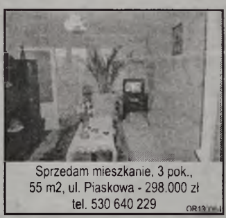
Przedam mieszkanie, 3 pok., 55 m2, ul. Piaskowa - 298 000 zł tel. 530 640 229