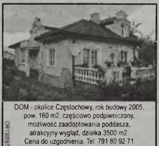
DOM - okolice Częstochowy, rok budowy 2005, pow. 160 m 2 , częściowo podpiwniczony, możliwość zaadoptowania poddasza, atrakcyjny wygląd, działka 3500 m 2 . Cena do uzgodnienia. Tel. 791 80 92 71

DOM, w Opolu, warsztat, możliwość prowadzenia działalności gospod. - 350.000 zł. Opole, tel. 77/45-27-37, 697/22-02-33 G12HHKW