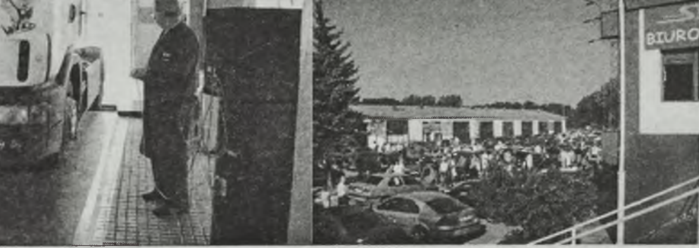
FOTO IVECO 75-15 EUROCARGO KONTEJNER , 2001 r., 500 tys. km, 4000 ccm, hydroklapa, retarder, wiinda, tachograf, aeropakiety, na poduszczkach, 6-bieg., nieeksploatowany w kraju, wyposażenie el. wspomaganie kier., CB-radio - 15.900 zł netto, po opłatach, www.auto-rein.auto.com.pl. Środa Śląska, tel. 71/317-26-51, 601/70-22-45 I13R747

Spółdzielnia Pracy Transportowo-Spedycyjna Wrocław, ul. Gnieźnieńska 6-8 tel. 71/355-67-84 e-mail: biuro@spts.wroc.pl