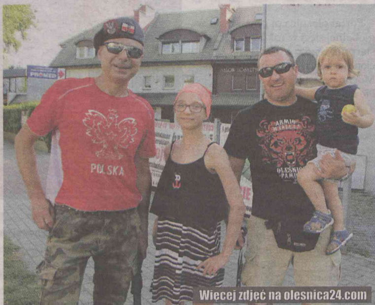
Wiecej zdjęć na olesnica24.com

Blisko 100 oleśniczan uczestniczyło w symbolicznym upamiętnieniu ofiar Powstania Warszawskiego.