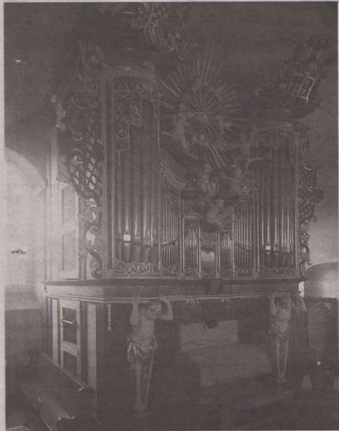
Tak organy wyglądały w okresie swojej świetności