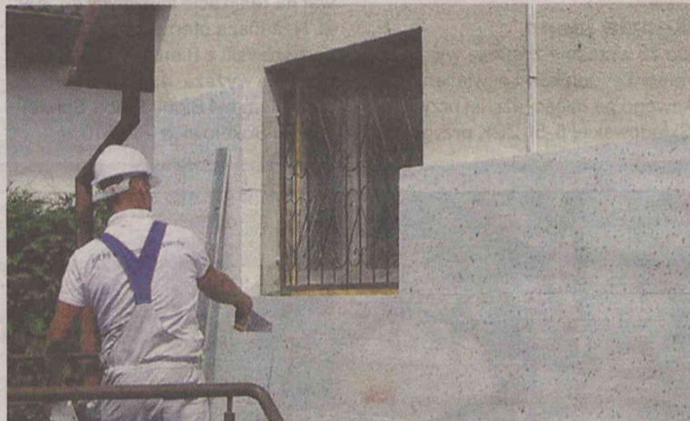
Docieplenie wykonała inna firma

4 czerwca wykonawca nie pojawił się w Śmiałowicach. Ba, nie pojawił się do 4 sierpnia, czyli do