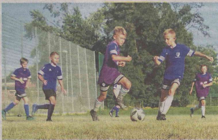
Upał nie upał, grać trzeba!

„Zapraszamy wszystkich chętnych na nasze treningi wakacyjne, bez względu na poziom zaawansowania, czy przynależność klubu” - zachęca Akademia. APO ma już za sobą pierwsze przedsezonowe sparingi. Oprócz kilku gier kontrolnych na obozach piłkarskich, odbyły się również sparingi w Oleśnicy. Seniorzy grali dwukrotnie i tyle samo razy wygrali. Reprezentacja rocznika 2006 podejmowała sycowską Po-