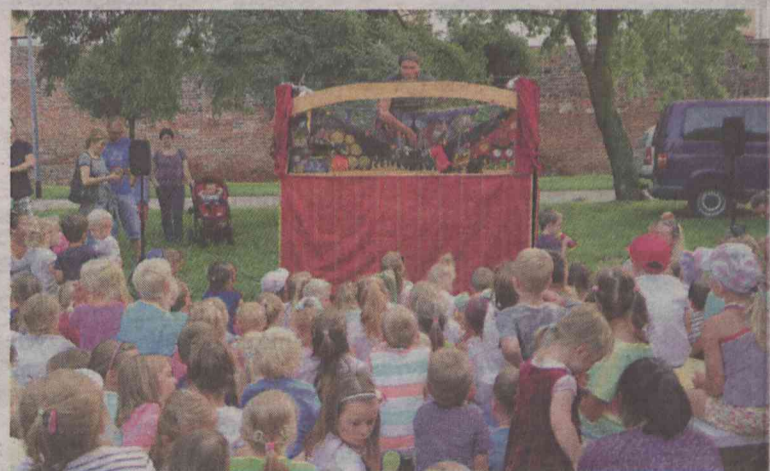
Plenerowe spektakle mają wierną publiczność

W programie dopołudniowe warsztaty i popołudniowe spektakle, w czasie których będzie można spotkać z jedną z najbardziej tradycyjnych form opowiadania bajek, baśni, legend i wielu innych opowieści. Ta tradycyjna forma, jaką jest teatr kukielkowy, cieszy się od