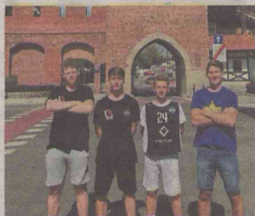
Młodzi szturmują I skład