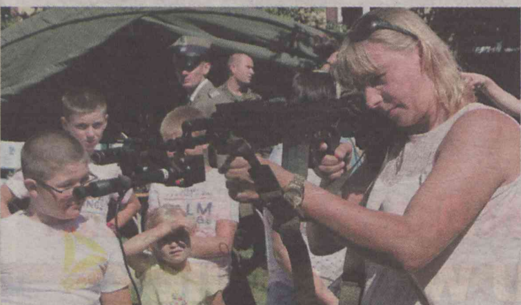
Każdy będzie mógł poczuć się jak żołnierz

Wejście do koszar będzie się odbywało główną bramą od ulicy Wileńskiej 14 (wymagane jest posiadanie dokumentu potwierdzającego tożsamość) od godziny 9.30 do 11.30. W samo południe zostanie odprawiona uroczysta Msza Św. w kościele NMP Matki Miłosierdzia. Po mszy, ok. godz. 13, nastąpi złożenie wiązanek pod Pomnikiem Kombatantów. (ror)