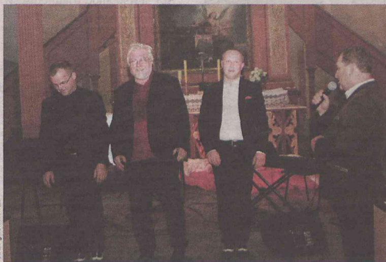
Trio uczciło rocznicę w sposób nieszablonowy

Aby wprowadzić radośniejszą atmosferę, muzycy postanowili unikać melodii kojarzonych z patetycznymi uroczystościami („Tych z pewnością w tym roku będzie już wystarczająco dużo” - wyjaśnili). Zdecydowali się przybliżyć słuchaczom muzykę bezpośrednio związaną z kulturą tych czasów, w których nasz kraj wybijał