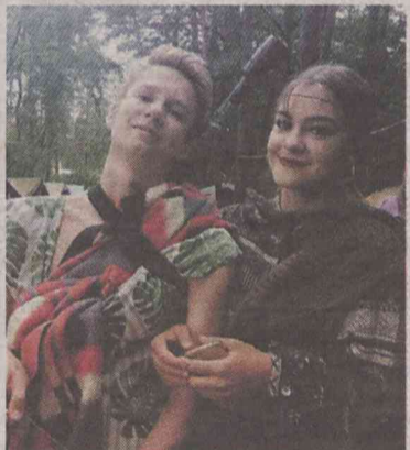
Były też przebieieranki

„To był naprawdę wspaniały czas. Przeżyliśmy razem wiele przygód i stworzyliśmy wspaniałe wspomnienia, które zostaną z nami na zawsze. Razem nauczyliśmy się tak wielu rzeczy.