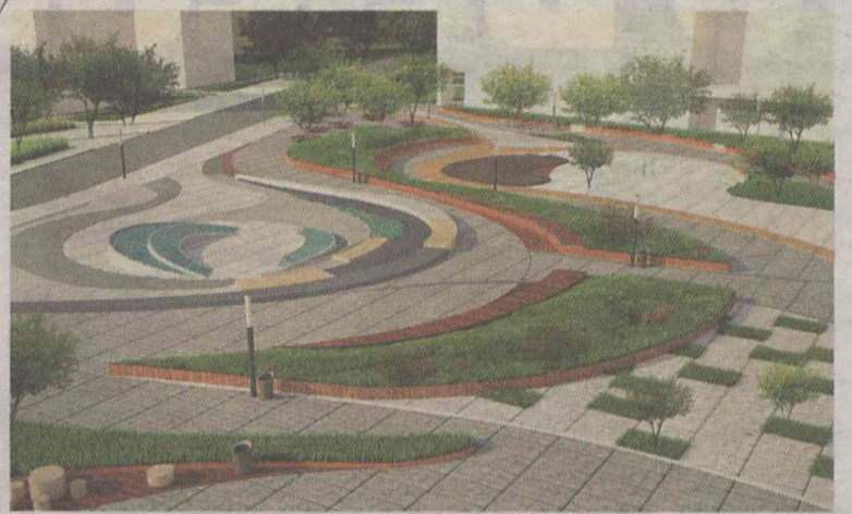
Plac zmieni się radykalnie

Obszar do przebudowy obejmujący powierzchnię ok. 12.810 mkw.