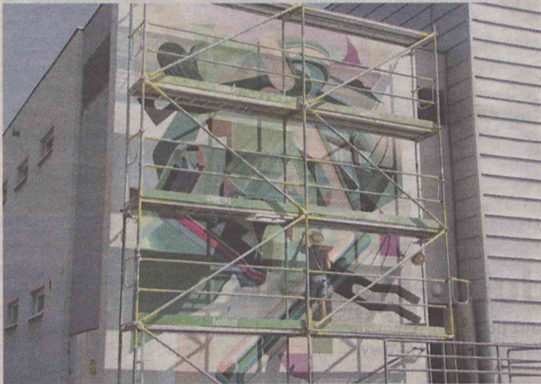
Oto piąty mural wykonany w ramach OFCY