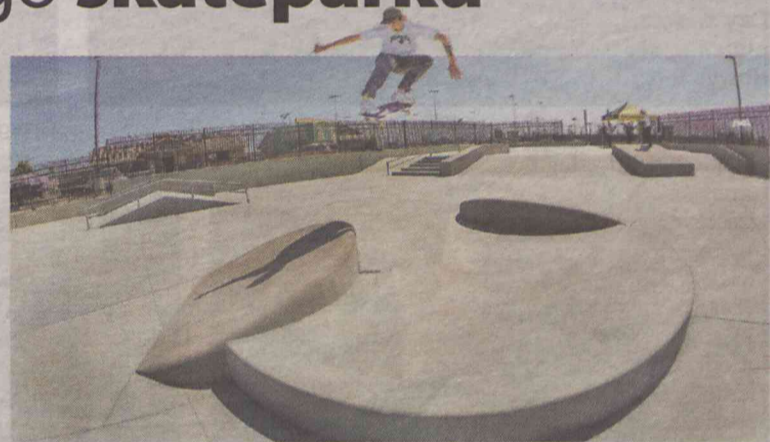
Skatepark powstanie. Ale gdzie?

„Rampy, które jak dotąd powstały w naszym mieście, zostały wykonane przez niekompetentną firmę i nie nadają się do użytku przez młodzież i dzieci. Moją propozycją jest budowa nowego skateparku przy ulicy Wojska Polskiego, gdzie został już wykonany tor dla rowerów górskich. Projekt ten zapewni miejsce do rozwijania swoich pasji dla dużej grupy dzieci i młodzieży. Miejsce to jest idealne na budowę nowych ramp, ponieważ w najbliższej okolicy nie znajdują się