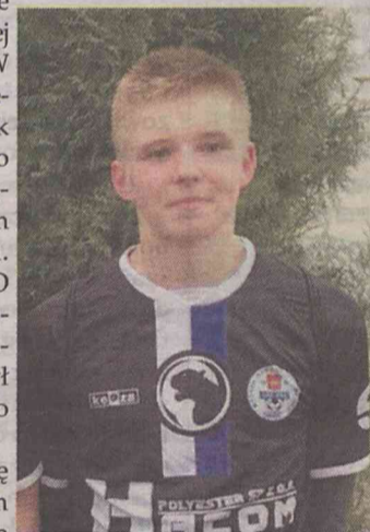
Jazda, Mostek, Biała Gwiazda!