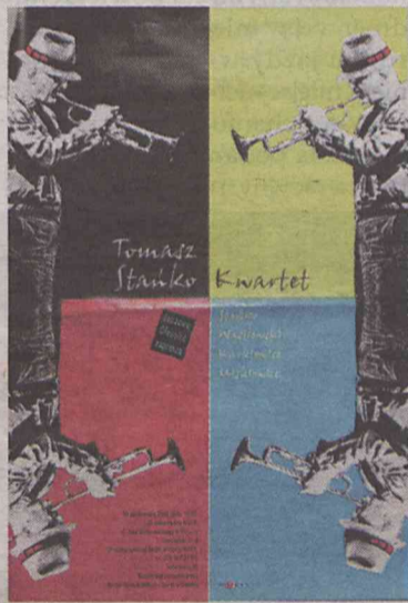
Mistrz dwukrotnie zagrał w Oleśnicy

W tym samym składzie zespół pod wodzą mistrza zagrał w Oleśnicy 7 lat później. Tym razem był to koncert w miejskiej sali widowiskowej w ramach cyklu „Jazzowa Oleśnica Zaprasza”. Wielu fanów wysublimowanego jazzowego brzmienia z pewno-