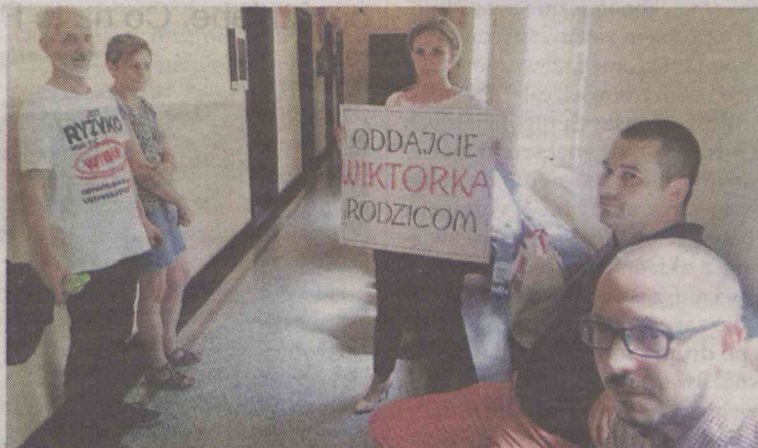
Rodziców wspierała grupa przedstawicieli kilku organizacji i poseł

Rodzice od początku sprzeciwiali się decyzji Sądu.