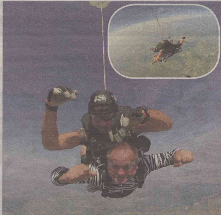
Zebra, czyli radny w powietrzu nad lotniskiem Szymanów

A wrażenia? Mówi, że „nie do opisania”. - Około minuty spada się bezwładnie - żałowałem, że tak krótko - a potem otwiera się spadochron. Ze spadochronem spada się około czterech minut. Na wysokość około 4.000 tysięcy się wyląduje, skacze, swobodnie się spada do wysokości 1.700 metrów, czyli prawie 2,5 kilometra się leci na dół z prędkością 200 kilometrów na godzinę, a potem otwiera się spa-