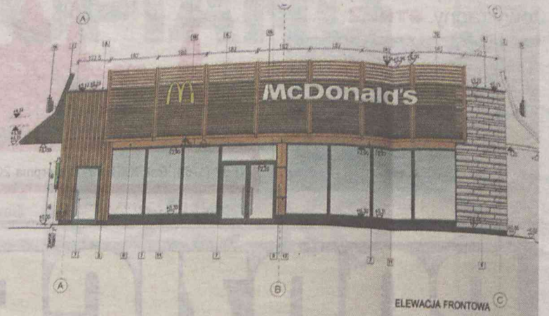
Taki będzie ich końcowy efekt

fundament budynku. Niebawem pojawią się tu gotowe, prefabrykowane, elementy konstrukcji. Obiekt zostanie otwarty w listopadzie (pierwotny termin mówił o październiku). Zatrudnienie ma tu znaleźć ok. 80 osób z Oleśnicy i okolic.