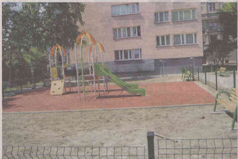
Podwórko zaferuje nowe atrakcje