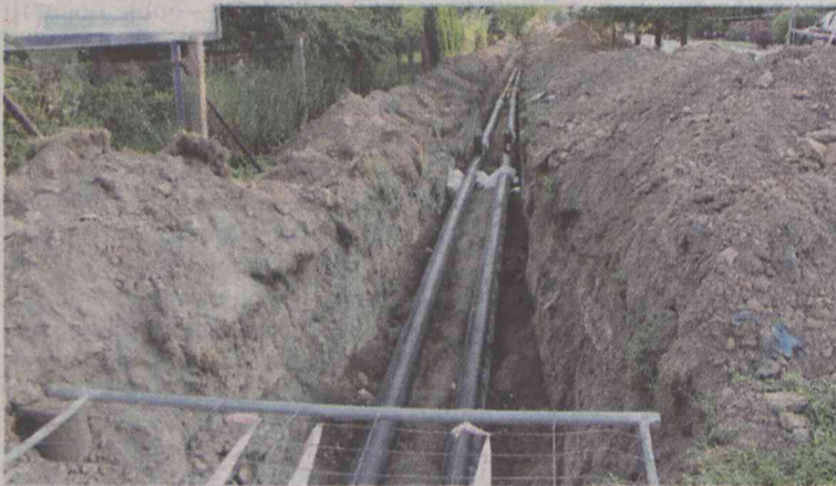
Kładą rurę dla... 4 mieszkańców

Budowa sieci rozdzielczej i przyłączy do zaledwie 4 z kilkudziesięciu budynków (co nie będzie miało wpływu na wielkość emisji) wykonywana jest na zlecenie MGK przez firmę ProjMan Tomasz Kasprzak z Kalisza za kwotę 239,8 tys. zł. Trudny, wąski, zurbanizowany teren o stosunkowo dużym zagęszczeniu istniejących sieci (woda, kanalizacja, energia, gaz) sprawia, że prace przyłączeniowe będą skomplikowane i do końca nieprzewidywalne. (hag)