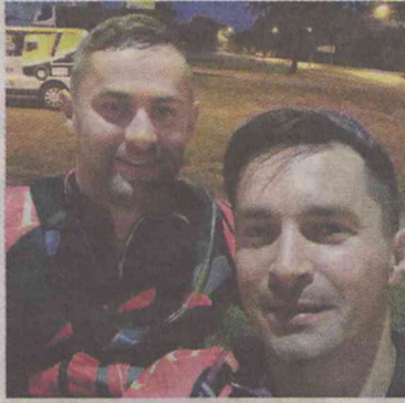
Na Hel dotarli w 40 godzin

10-latką od urodzenia cierpi na mózgową porażenie dziecięce. Ma dużą wadę wzroku, niedoczynność tarczycy oraz epilepsję. „To właśnie dlatego mam tak wielkie trudności