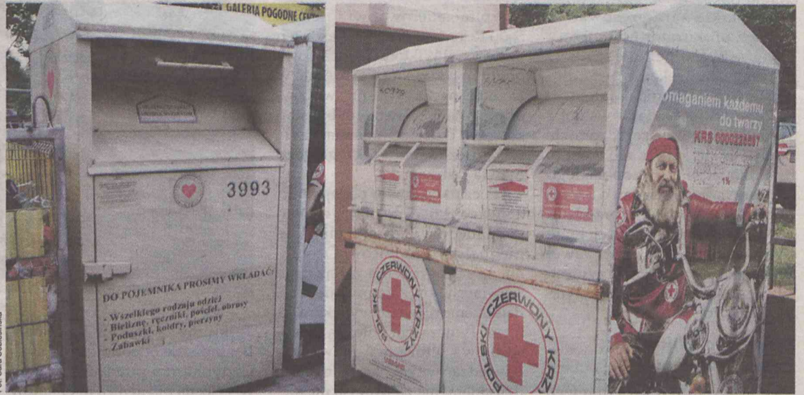
Z lewej kontener prywatnej firmy, z prawej PCK

Czytelnicy sygnalizują nam, że kontenery z używaną odzieżą nie są opróżniane. Co na to PCK?