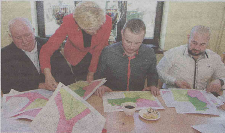
Na planach wygląda ładnie, gorzej z finansowaniem