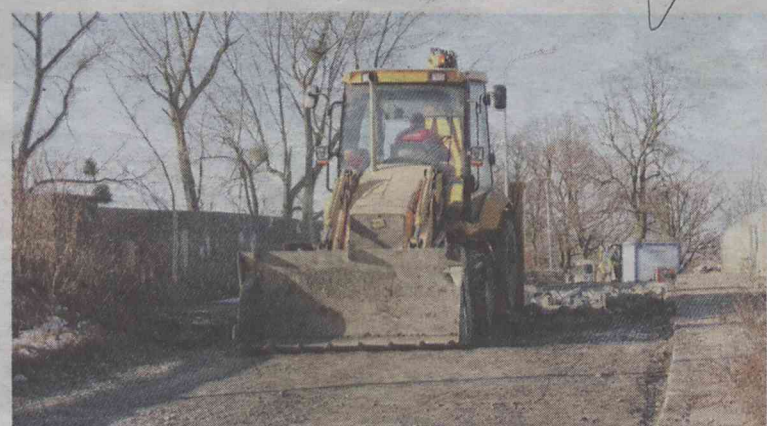
Nareszcie coś drgnęło!

We wtorek rozpoczęły się prace rozbiórkowe na wiadukcie przy ulicy Moniuszki. Możemy powiedzieć: Nareszcie!