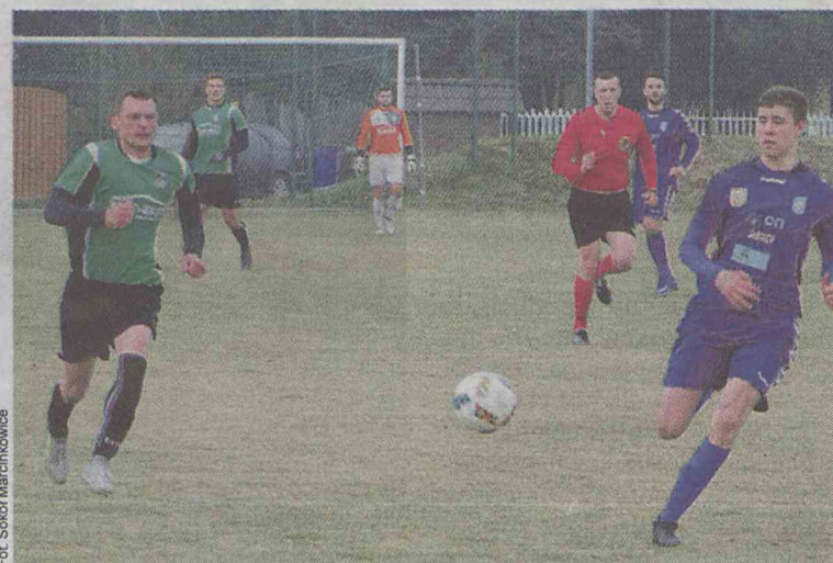
Z Marcinkowic pogoniarz wrócił na tarczę

Niestety, po zmianie stron gościom nie udaje się utrzymać prowadzenia z wiceliderem tabeli.