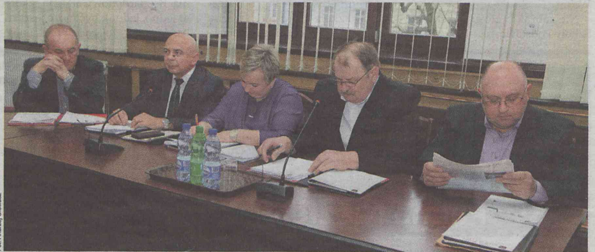
Obrady przebiegały bez większych emocji