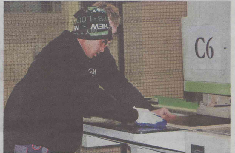
Nepalczyków cechuje pracowitość...

Nepal to demokratyczna republika federalna w Azji Południo-