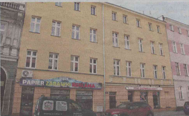
3 Maja 16