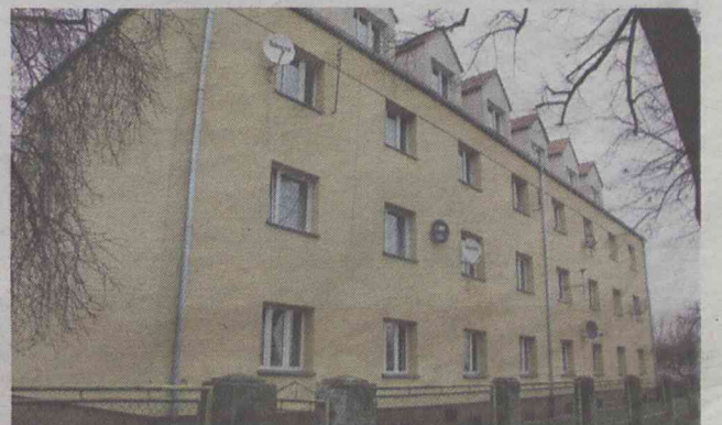
Wojska Polskiego 48-49