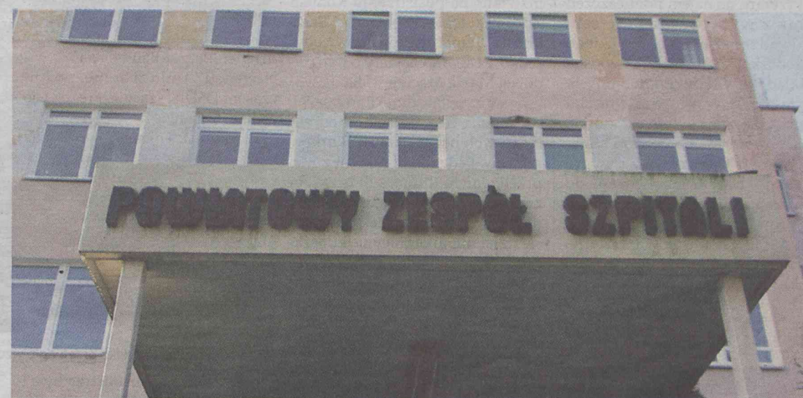
Odmówienie rodzinie dostępu do umierającego bliskiego jest nie do zaakceptowania

Skontaktowałam się z policją w Oleśnicy, która skierowała mnie do prokuratury. Następnego dnia skontaktowałam się z Sanepidem we Wrocławiu i Oleśnicy - bardzo miła osoba przy telefonie poinformowała mnie, że Sanepid nie zamknął szpitala i pani osobiście spróbuje mi pomóc skontaktować się z dyrektorem szpitala. Nie mogłam dłużej czekać i skontaktowałam się z sekretarką zastępcy dyrektora szpitala pana