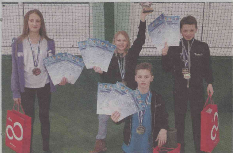
Były medale, dyplomy i nagrody