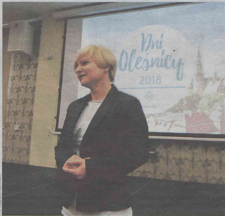
Dyrektor BiFK zaprasza już oleśniczan na święto miasta