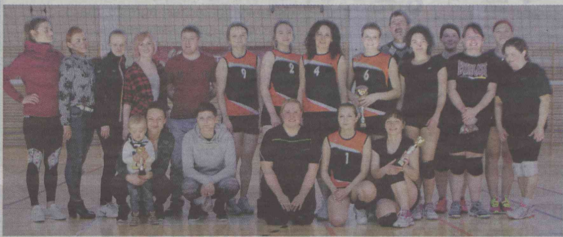
Siatkarki reprezentowały wysoki poziom