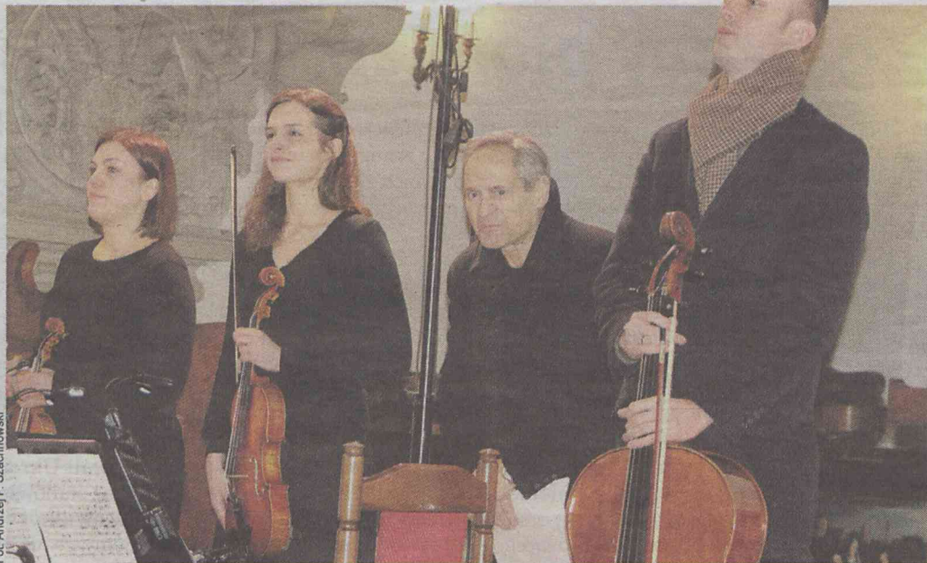
Jerzy Zelnik w otoczeniu muzyków