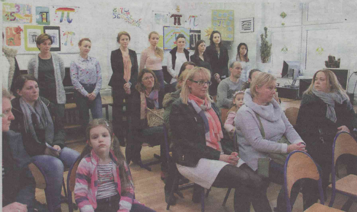
Szkole przybędzie kolejny rocznik