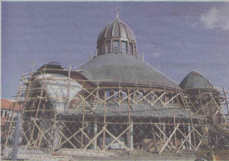
Czas goni, a pracy jest jeszcze sporo