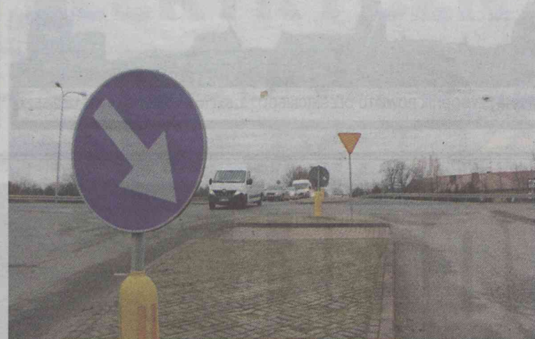
Kierowcy muszą uzbroid się w cierpliwość