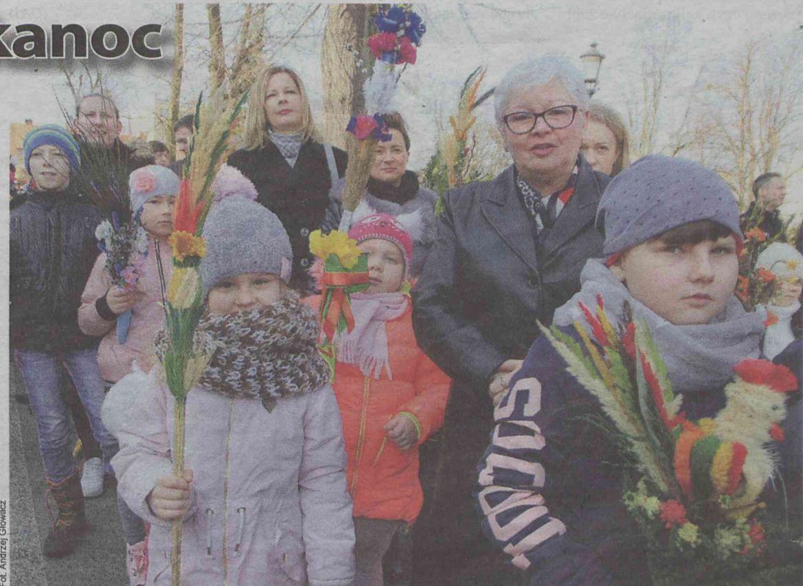
Czyja palma najładniejsza?

Andrzej Głowacz, Andrzej Paweł Szachnowski