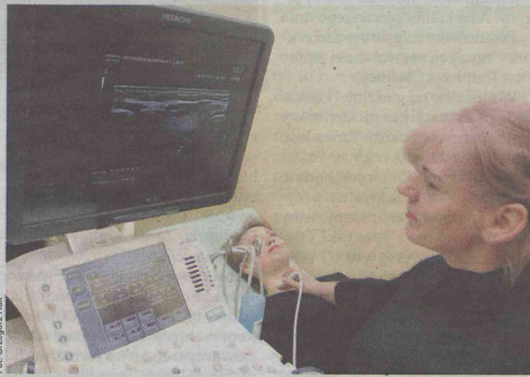
Dzięki takiemu USG widać więcej