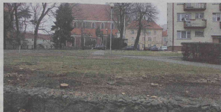
No i nie ma się gdzie ukryć...

Zrobiło się jasno, czysto i, co najważniejsze, bezpiecznie. Ta wycinka była w pełni uzasadniona.