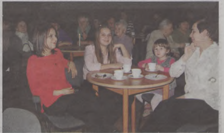
Widownię zdominowały panie

tanga, muzykę filmową oraz muzykę współczesną. Występ spotkał się z żywiołowym aplauzem. (OAI)