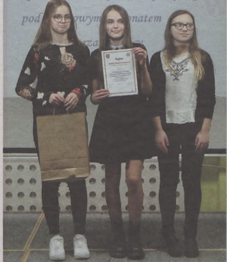
Język ojczysty znają doskonale

jętki powiedział wszystko, co pomyśli głowa