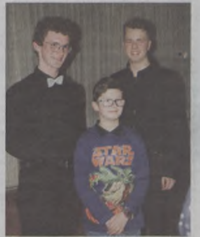
Fotka z wirtuozami

A 11 marca zagraли na scenie Miejsko-Gminnego Ośrodka Kultury w Międzyborzu. Fenomenalny duet akordeonistów miał okazję zagrać dla pań. W swoim repertuarze muzycy mieli m.in.