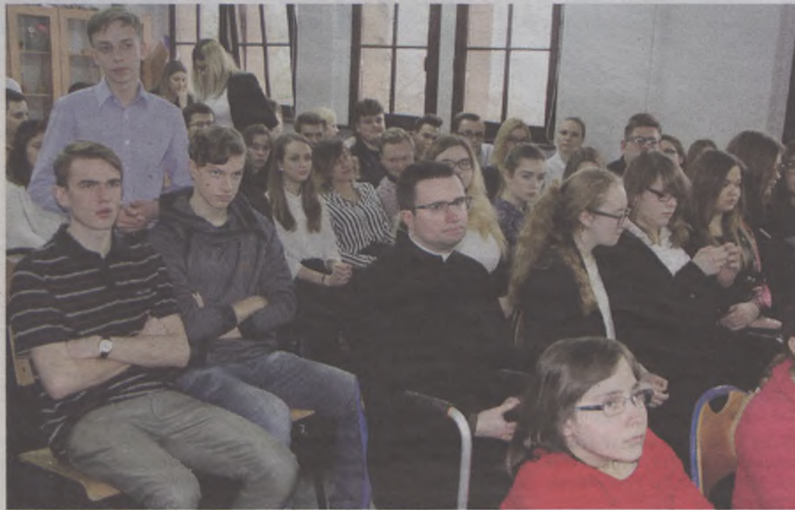
Dzięki tej inicjatywie o swoim burmistrzu wiedzą więcej

Zapewnił: „Staram się trzymać samorząd z dala od partyjnej polityki. Tłumaczył: „Muszę stać na straży interesu miasta”.