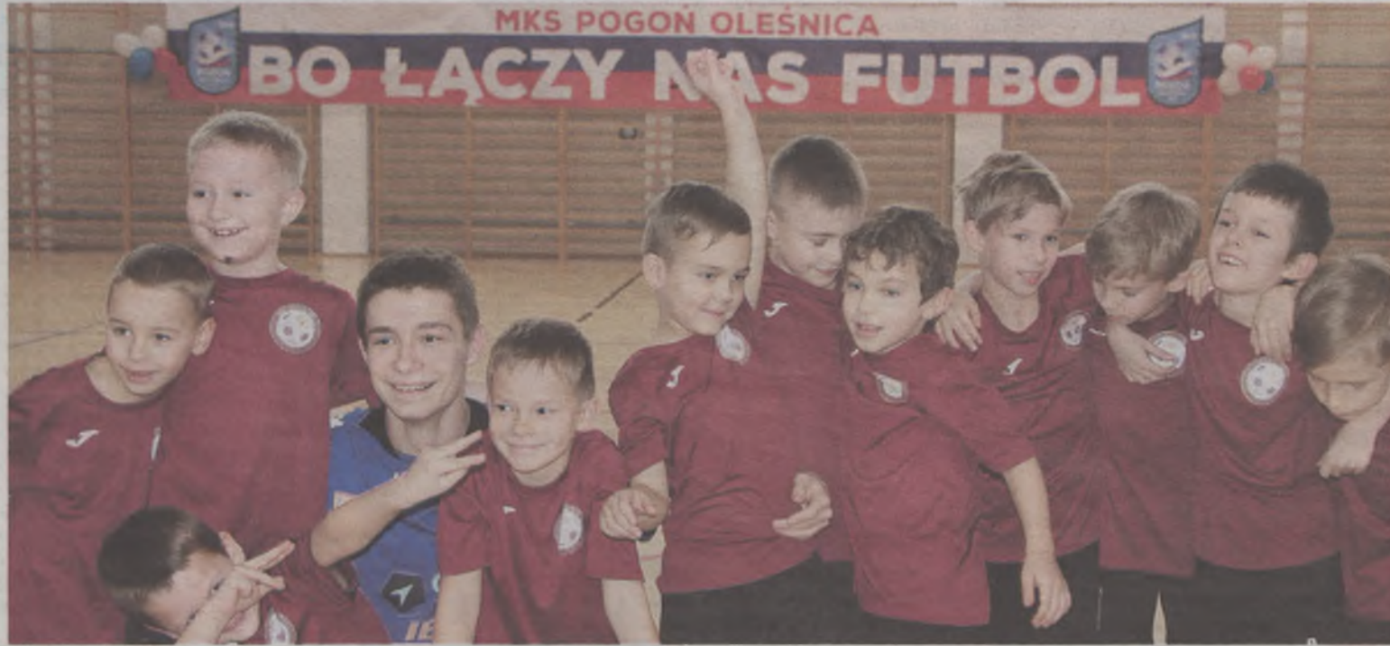
Futbol miał łączyć, ale czy tak jest?...