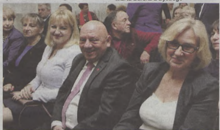
Nie zabrakło reprezentacji Bierutowa