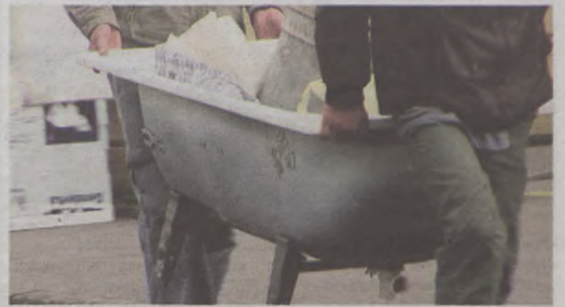
Sprzątanie zmieniło się w czyszczenie do zera...

- Powiedziała Adrianowi P., że może przez trzy miesiące bezpłat-