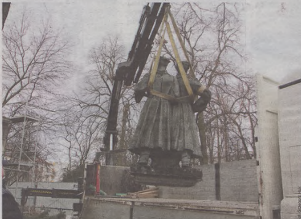
Historia oleśnickiego obelisku dobiegła końca