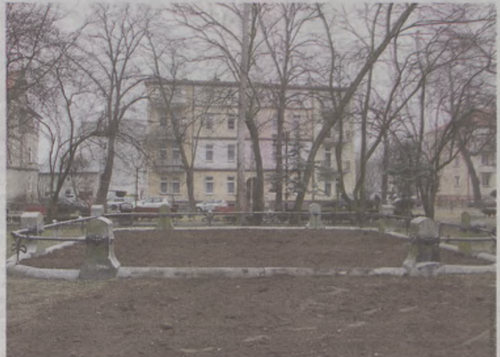
Pusta przestrzeń czeka na zagospodarowanie