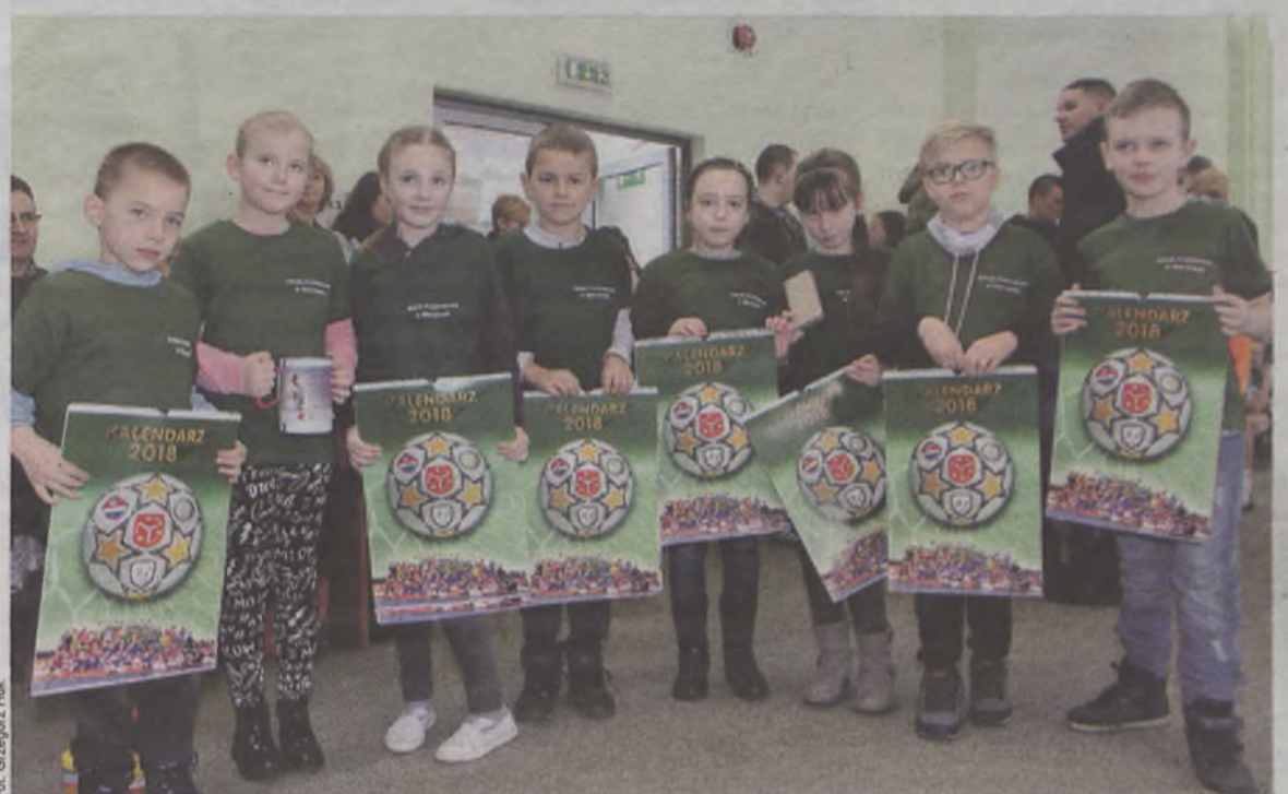
Młodzi wolontariusze mieli pełne ręce roboty