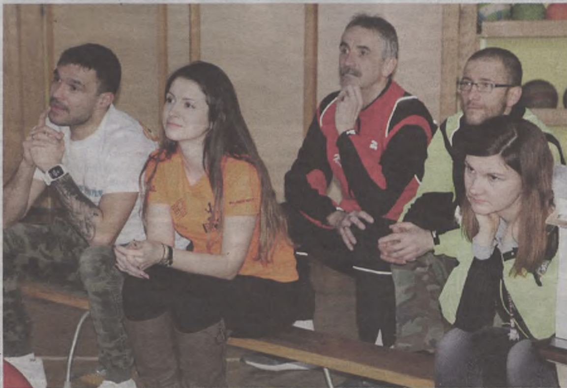
Animatoryzy sportu z uwagą słuchali o inicjatywie MultiSport

Każda z zakwalifikowanych placówek przystępuje do testu dwukrotnie, w odstępie 6 miesięcy. O końcowym sukcesie decyduje osiągnięty w tym czasie progres. (OAI)