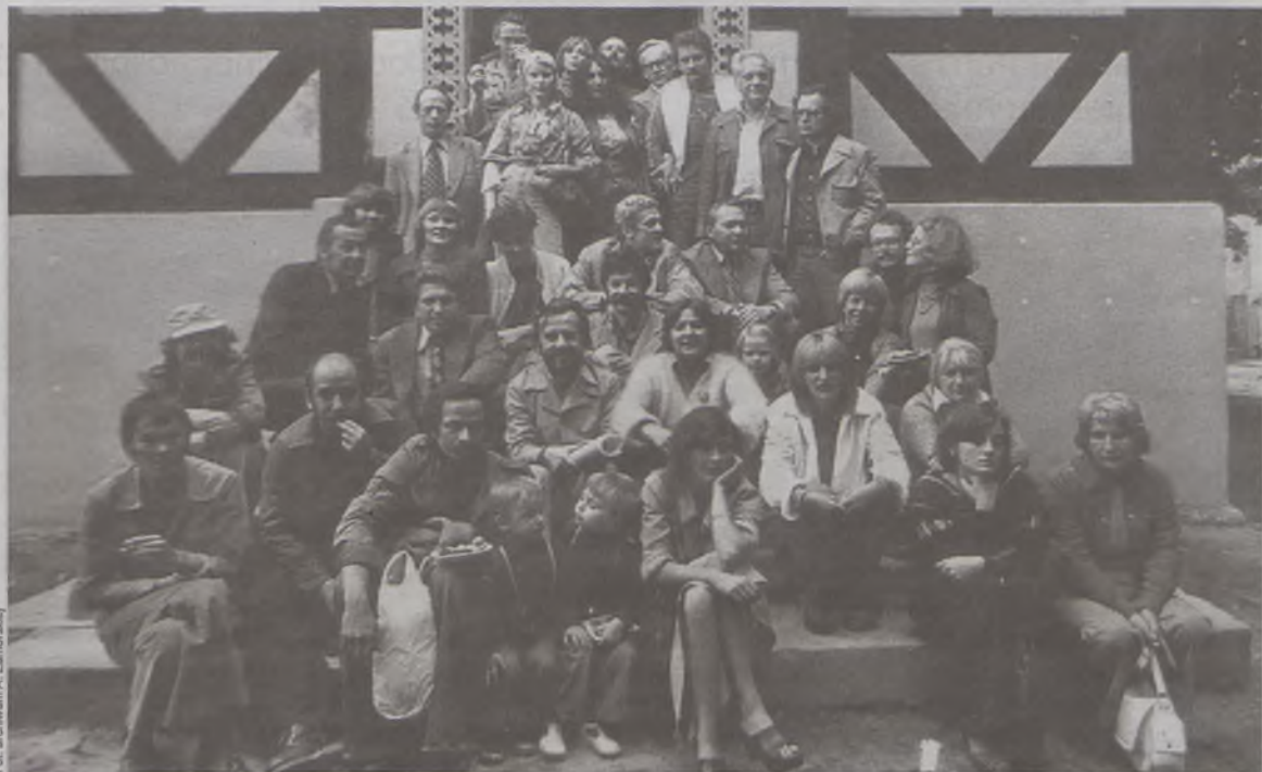
Ta fotografia jest pamiątką po artystycznym twardogórskim epizodzie...

Może ktoś zapamiętał grupę artystów z lata 1977 roku? Był wśród nich m.in. Franciszek Starowiejski.