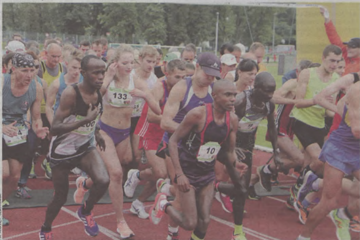
Czy zmiana organizatora zmieni charakter imprezy?

Informacje Panoramy okazały się prawdziwe - Memoriał Psujka zorganizuje w tym roku Cała Oleśnica Biega.