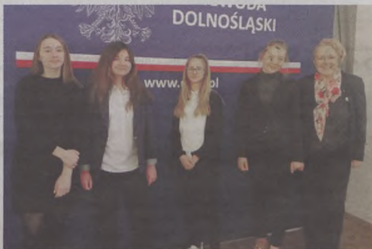
Zawsze gotowi na nowe wyzwania...

Szkoła Podstawowa nr 7 jest współorganizatorem wystawy w Urzędzie Wojewódzkim.