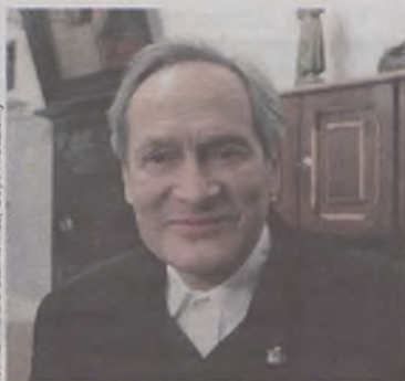
Świetny aktor wystąpi dla oleśniczan

- Siedem słów?... Czy raczej ostatnie siedem nauczają cierpiącego człowieka - Boga. Liturgia umiarnia. Jego testament duchowy. Józef Haydn postanowił muzyką opisać