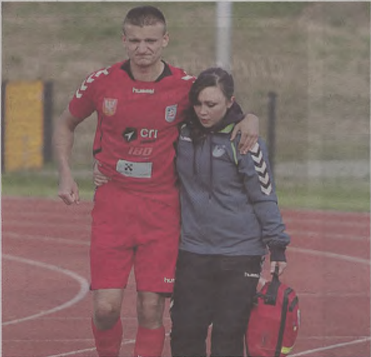
Jej umiejętności i wiedza już się przydają...