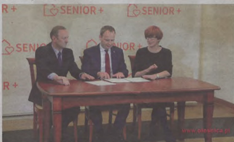
Umowa podpisana. Będą pieniądze...