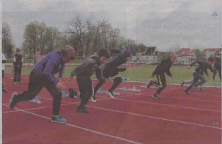
Jest jeszcze czas, by podszlifować formę