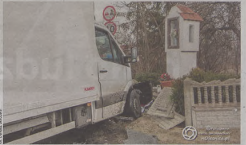
Kapliczka cudem ocalała...

Pasażerka toyoty doznała obrażeń i została przetransportowana karetką do szpitala. Urazy nie były poważne i kobieta po badaniach opuściła szpital. (OAI)