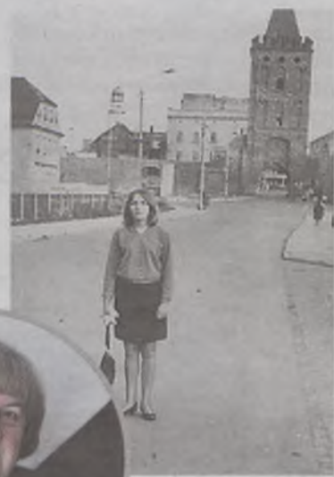
Zdjęcie - wspomnienie

czyła na szwedzki wiersze Rafała Wojaczka, poety z Wrocławia.