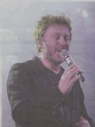
Piasek oddał połowę kasy...

„Ostatnia gwiazda Andrzej Piaseczny z zespołem niestety krótko przebywał na scenie, gdyż silny huragan uniemożliwił przeprowadzenie koncertu. To wydarzenie bez precedensu, gdyż jeszcze nigdy w wieloletniej historii Dni Twardogóry nie został przerwany żaden koncert”.