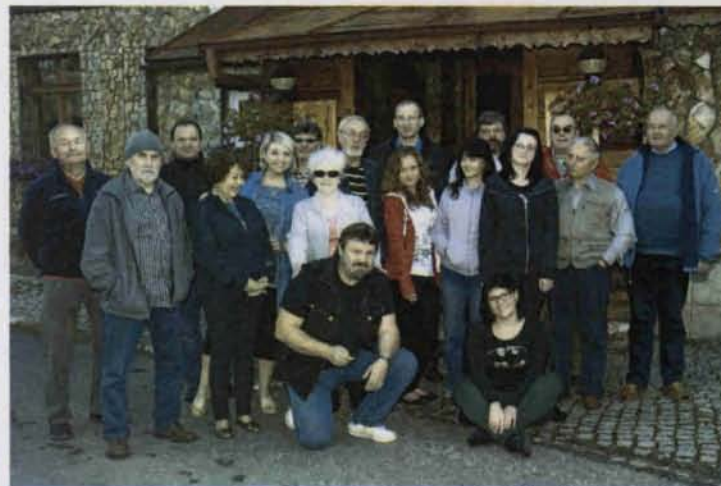
Fot. Mariusz Broszkiewicz