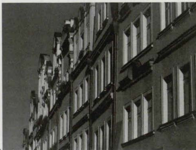
Ryszard Olszewski – nagroda młodzieżowa (oryginały barwne)