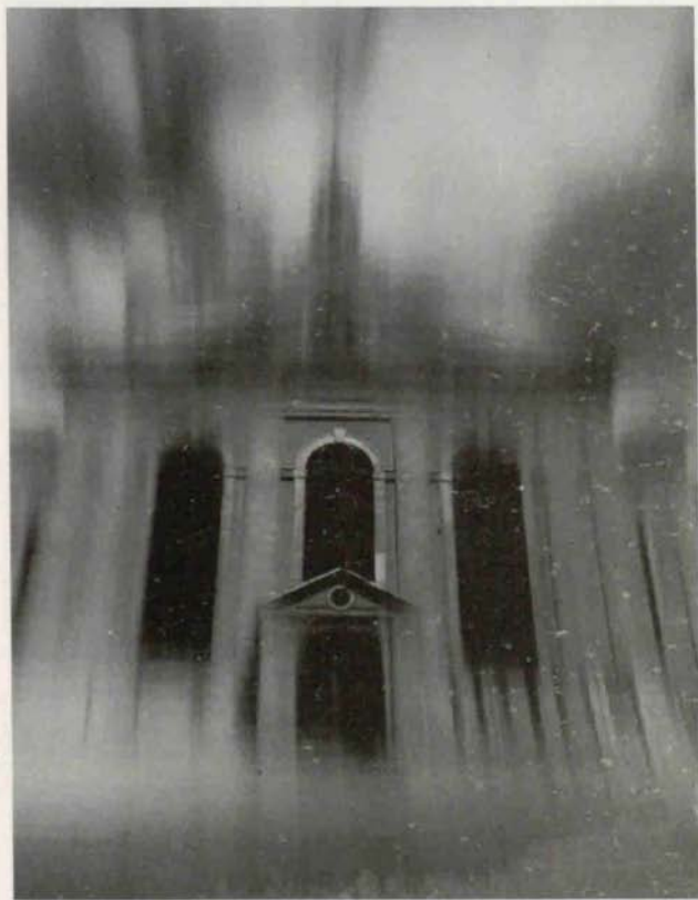
Teodor Gutaj – III nagroda (oryginal barwny)