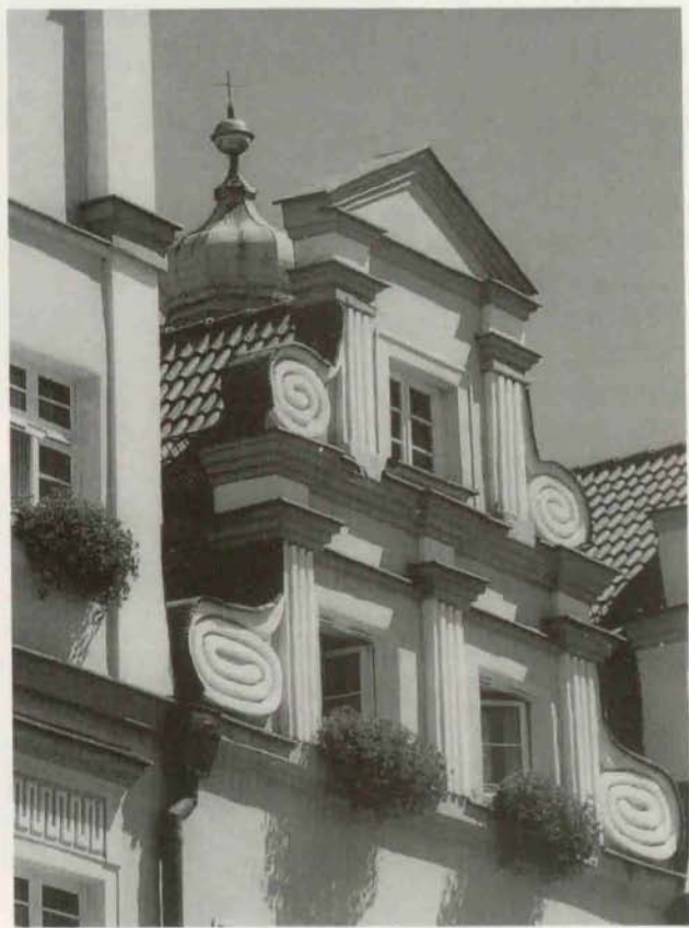
Tadeusz Bilozor – wyróżnienie (oryginał barwny)