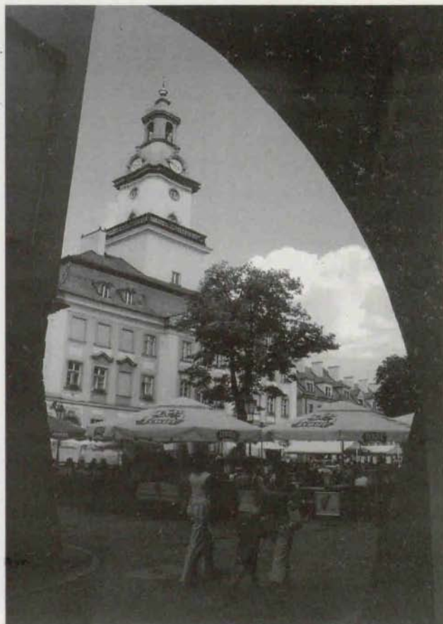
Tomasz Pytel – wyróżnienie (oryginał barwny)