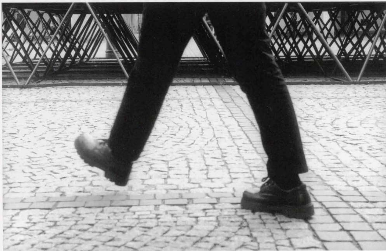
Krzysztof Przybysz - „Spotkanie 2” - wyróżnienie