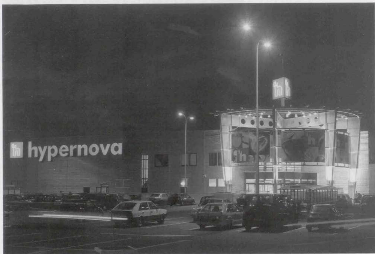
Tadeusz Biłozor - „hypernova”