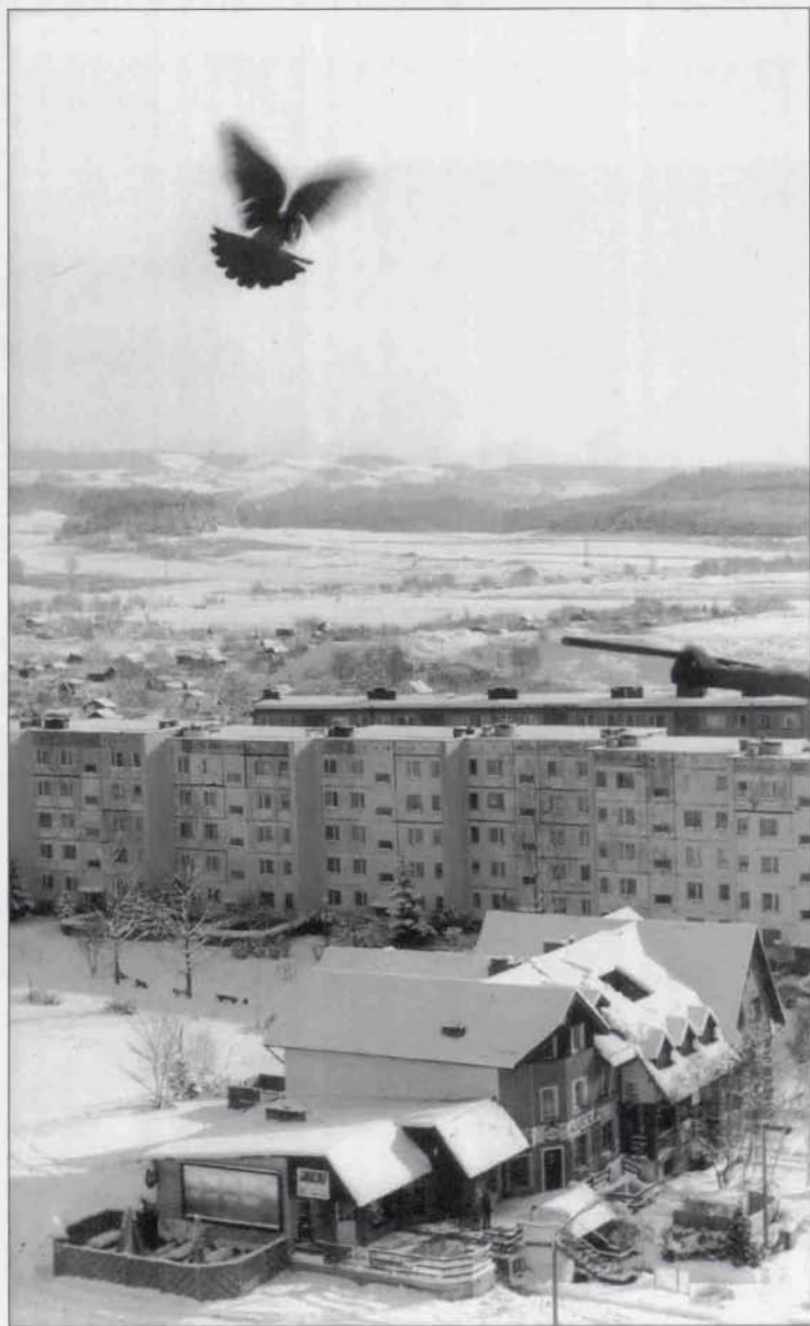
Jolanta Wilkońska - „Lot nad Zabobrzem” - wyróżnienie