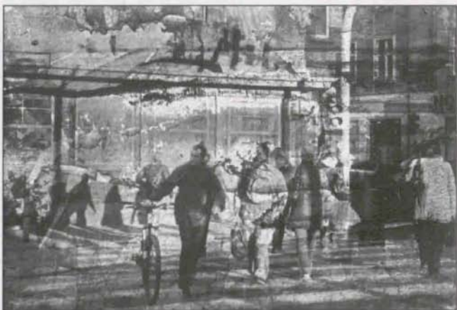
Wojtek Bykowski – III nagroda