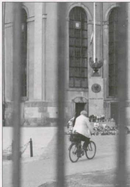
Filip Wieczorek – nagroda młodzieżowa