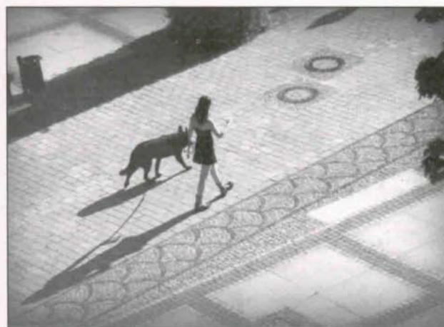
Ryszard Literacki – wyróżnienie