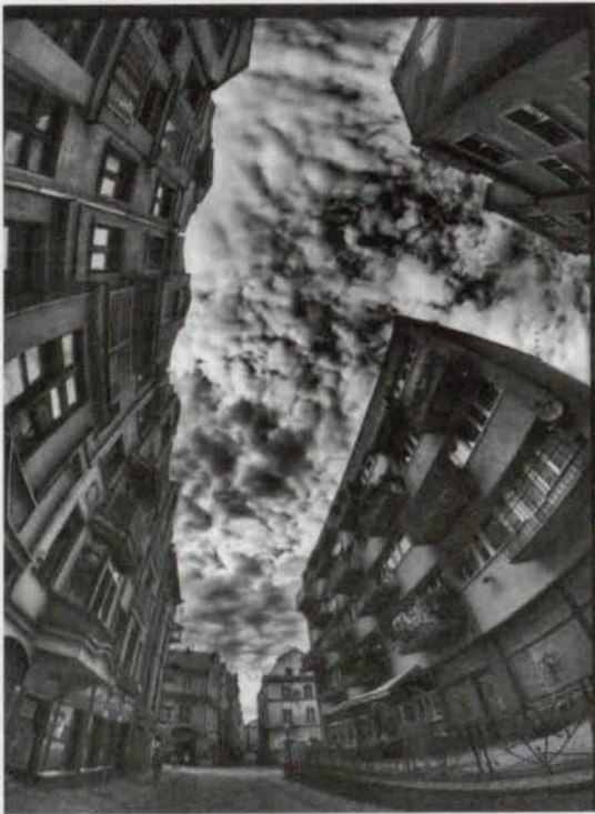
Piotr Garbat – III nagroda