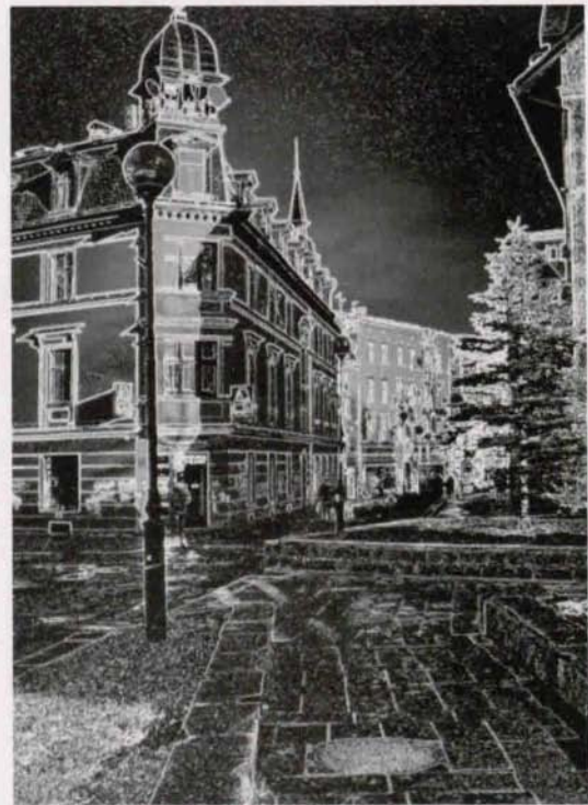
Ryszard Literacki – wyróżnienie