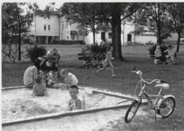
Jolanta Wilkońska – III nagroda