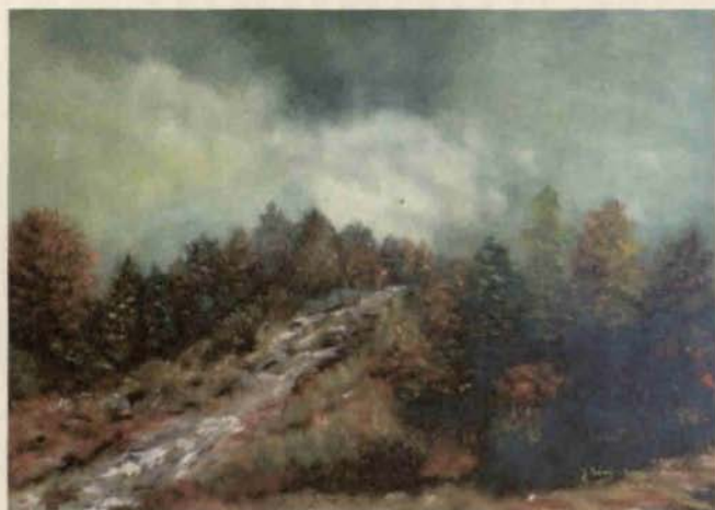
Górski stok - Jerzy Tański