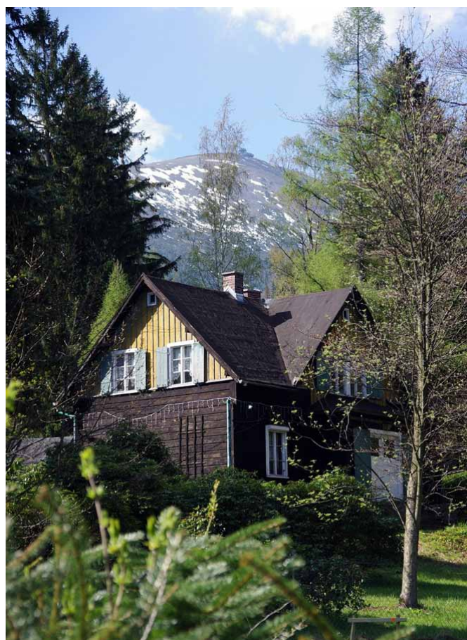
Fluchtburg (przed pracami remontowymi w latach 2018-2020). W oddali widok na Śnieżkę