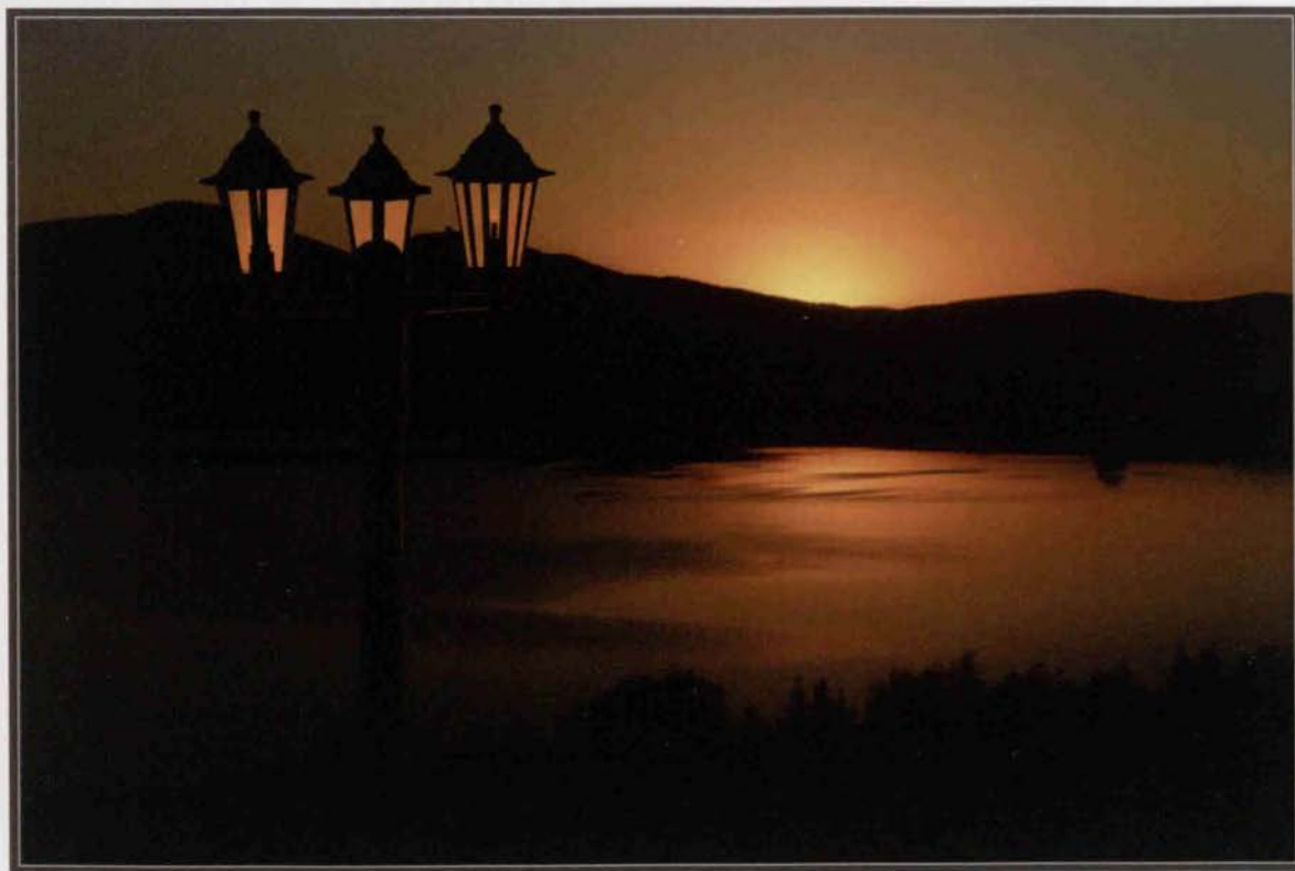
Jan Foremny „Zachód nad Sosnówką”