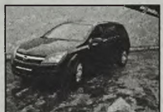
FOTO OPEL ASTRA KOMBI , 2006/07 r., 99 tys. km, 1700 ccm, CDTi 100 KM, szary metalik, 5-drzw., bez wypadku, garażowany, kierowca niepalący, kpl. dokumentacja, l. właściciel, serwisowany, zarejestr., ABS, alum. felgi, c. zamek, el. otw. szyby, el. reg. lusterka, ESP, immobilizer, klimatyzacja, komputer pokł., pod. pow., RO, wsp. kier. - 26.900 zł. Legnica, tel. 606/14-33-94, 76/854-02-84 www.autocharles.autogielda.pl autocharles@interia.pl K10857902