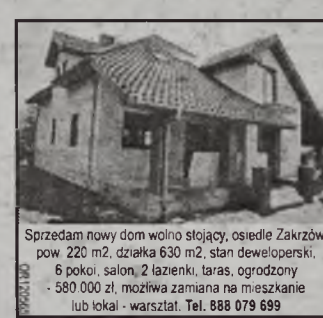
Przedam nowy dom wolno stojący, osiedle Zakrzów, pow. 220 m 2 , działka 630 m 2 , stan dewelopera. 6 pokoi, 2 łazienki, taras, ogrodzony - 580 000 zł, możliwa zamiana na mieszkanie lub lokal - warsztat. Tel. 888 079 699

DOM wolno stojący, pow. 140 m 2 , 6 pokoi, łazienka i w.c. osobno, garaż, pomieszc. socjalne, warsztat mechaniczny, 3 kanały, do wykończenia, działka pow. 31 a, bez pośredn. - 355.000 zł. Jugowiec, powiat średzki, tel. 71/396-67-58, 783/04-11-89 G129RNEM