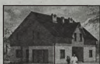
MIESZKANIA 49-75 m 2 z OGRODEM 71-138 m 2 z osobnym wejściem, 3 pokoje, z kominkiem, od 249 000 zł tel. 602 700 345 OR120557

MIESZKANIE 3-POKOJOWE , kuchnia, łazienka, przedpokój, pow. 61,4 m 2 , ogródek o pow. 8 a, 2 komórki, w miejscowości Olszanica - 120 000 zł. Olszanica, powiat złotoryjski, tel. 783/05-96-59 G12EFCCKA