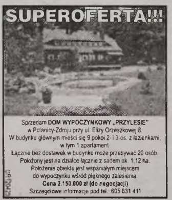
FOTO PENSJONAT - 2.150.000 zł. Polanica Zdrój, tel. 605/63-14-11 I12AKPJE PENSJONAT , w Szklarskiej Porębie, blisko wyciągu, 15 pokoi, pełny węzeł sanitarny, garaż, miejsca parkingowe - 2.000.000 zł. Szklarska Poręba, powiat jeleniogórski, tel. 607/19-10-05 G1ZAKRAN PENSJONAT , 12-pokojowy, z lokalem gastronomicznym, w okolicy Bolesławca + 2 mieszkania - 940.000 zł lub wynajem. Zebrydowa, powiat bolesławiecki, tel. 501/15-74-61 G197JHFLH

PENSJONAT , w miejscowości Łęknica, blisko granicy z Niemcami, pow. 360 m2, 6 pokoi z łazienkami, przystosowany dla osób niepełnosprawnych, salon o pow. 100 m2 z barem, parking wyłożony łupkiem, teren ogrodzony, brama elektr., działka pow. 24 a - 429.000 zł lub zam. na mieszkanie z dopłatą Łęknica, powiat żarski, tel. 607/24-26-56 G1XCW4J