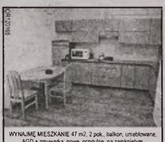
WYNAJĘCIE MIESZKANIE 47 m 2 , 2 pok., balkon, umebowane, AGD + zmywarka, nowe, przylucne, na zamkniętym, monitorowanym osiedlu, cena 1.200 zł + media, tel. 609 010 881

DO WYNAJĘCIA MIESZKANIE 2-POKOJOWE , pow. 40 m 2 , komfortowe, w centrum, przy ul. Armii Krajowej - 1.750 zł/mies. + media. Wrocław, tel. 512/23-95-28 GI29MHPW