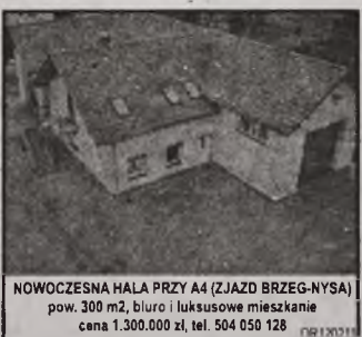
NOWOCZESNA HALA PRZY A4 (ZJAZD BRZEG-NYSIA) pow. 300 m 2 , biuro i luksusowe mieszkanie cena 1.300.000 zł, tel. 504 050 128 0910318

HALA PRODUKCYJNA , pow. 950 m 2 , budynek mieszkalny 120 m 2 , w okolicy Wieruszowa - 1.000.000 zł. Tel. 508/37-76-31 1I0RL39K