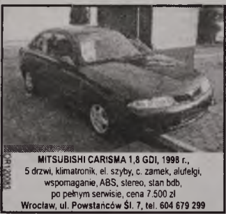
MITSUBISHI CARISMA 1.8 GDI, 1998 r., 5 drzw., klimatronic, el. szyby, c. zamek, alufelgi, wspomaganie, ABS, stereo, stan idealny, po pehym serwisie, cena 7 500 zł Wrocław, ul. Powstańców Śl. 7, tel. 604 679 299

FOTO MITSUBISHI CARISMA SEDAN, 2001 r., 155 tys. km, diesel, czerwony, 4-drzw., kierowca niepalący, sprowadzony, zarejestr., ABS, c. zamek, el. reg. lusterka, klimatyzacja, komputer pokł., 4 pod. pow., reg. kierownica, RO, wspom. kier. - 7 000 zł. Głogów, tel: 691/57-44-94 I12AFYMW