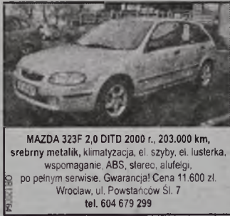
MAZDA 323F 2,0 DITD 2000 r., 203.000 km, srebrny metalik, klimatyzacja, el. szyby, el. lusterka, wspomaganie ABS, sterolec, alufelgi, po pełnym serwisie. Gwarancja! Cena 11 600 zł Wrocław, ul. Powstańców Śl. 7 tel. 604 679 299

MAZDA 323, 1999 r., 170 tys km, 1400 ccm, benz., srebrny met., ABS, c. zamek, 2 airbagi, welurowa tap.