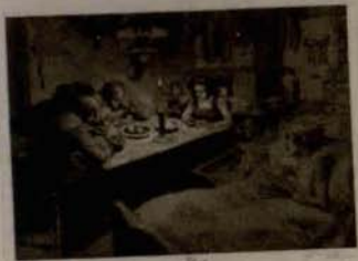
„Woźnica Henschel” „Fuhrmann Henschel”