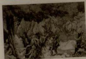
„A Pipa tańczył” „Und Pippa tanzt”