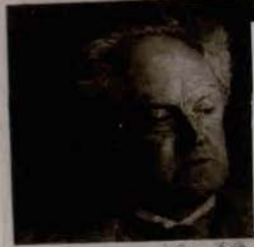
Portret G. Hauptmanna Bildnis G. Hauptmann