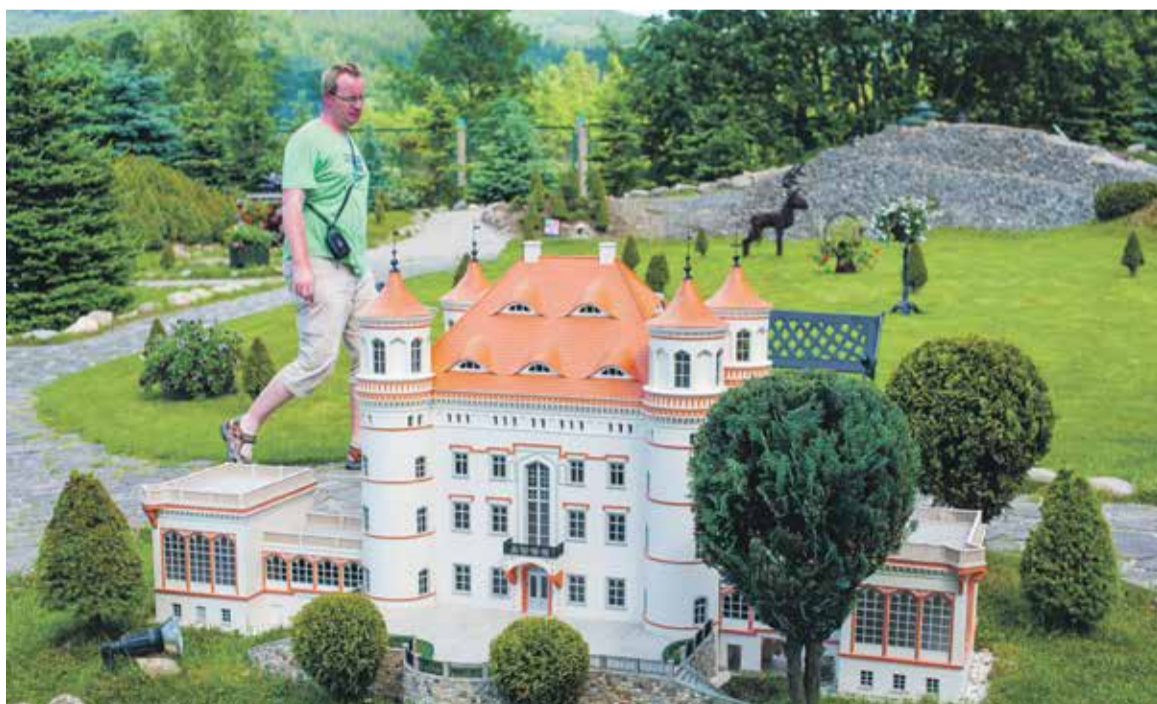
Miniatury kowarskie to atrakcja nie tylko dla najmłodszych