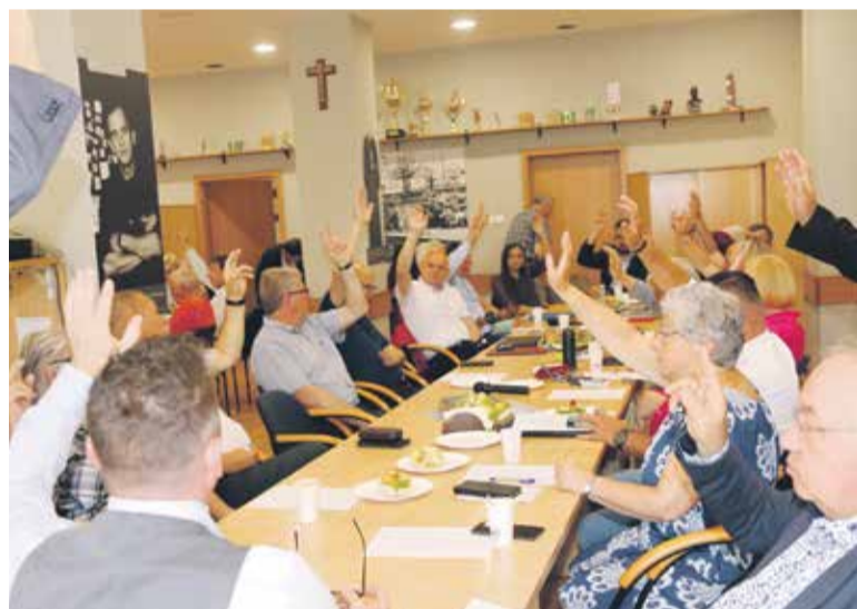
Podczas głosowania nad jedną z uchwał

Poniedziałkowe (19.06) posiedzenie Zarządu Regionu poświęcone było w głównej mierze sprawom organizacyjnym. Pierwsze po czerwcowym WZD zebranie rozpoczęło się od ślubowania członków ZR. Następnie w tajnych wyborach wyłoniono prezydium ZR.