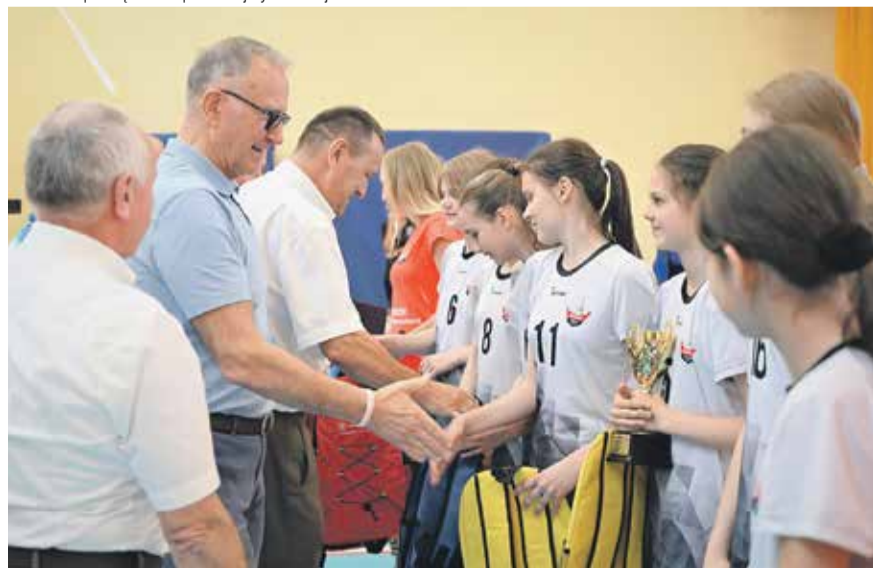
Gratulacje dla uczestników siatkarskich zmagani