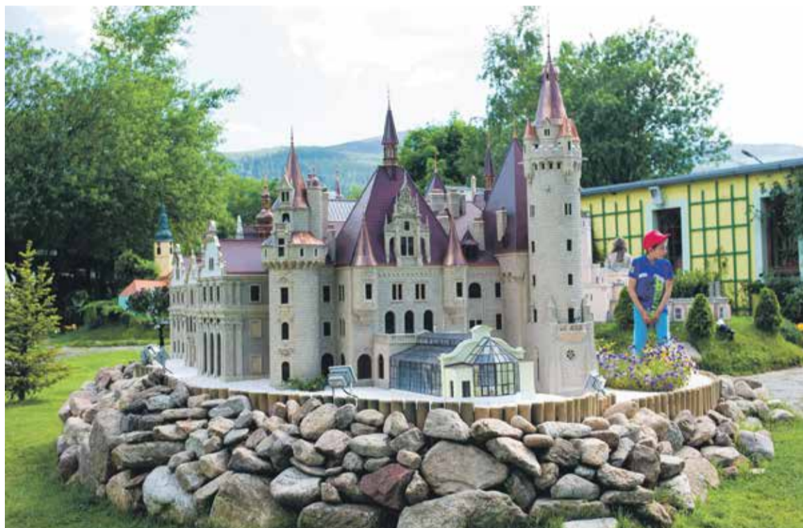
Ekspozycja w parku miniatur w Kowarach

Tipi Town znajduje się zaledwie 17 km od centrum Wrocławia. „Tutaj poznasz zwyczaje i kulturę Indian. Spędzisz wraz z rodziną i przyjaciółmi sielskie chwile w kolorowych hamakach wśród drzew w sadzie. Być może w jednym z namiotów tipi spotkasz szamana nuczającego plemienne pieśni. Wysłuchasz przy ognisku pod totemem niezapomnianych historii i legend z życia wielkich wojowników” – zachęcają organizatorzy. Można tu zdobyć sprawności indiańskie, wziąć udział w bloku gier i konkursów zespołowych. Atrakcją jest także tutejszy zwierzyniec czy labirynt w kukurydzy. Sporą atrakcją stanowią także warsztaty rękodzieła: wyplatania indiańskich branso-