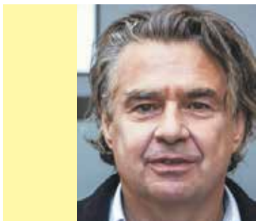
Autor jest reportażystą, felietonistą, powieściopisarzem. Obecnie pracuje w TVP3 Opole i TVP Info.

Jak wykazują dane Eurostatu, instytucji, którą trudno posądzić o sympatię do obecnego, konserwatywnego rządu Polski, bezrobocie w naszym kraju jest najniższe w całej Unii Europejskiej (ex aequo z Czechami).