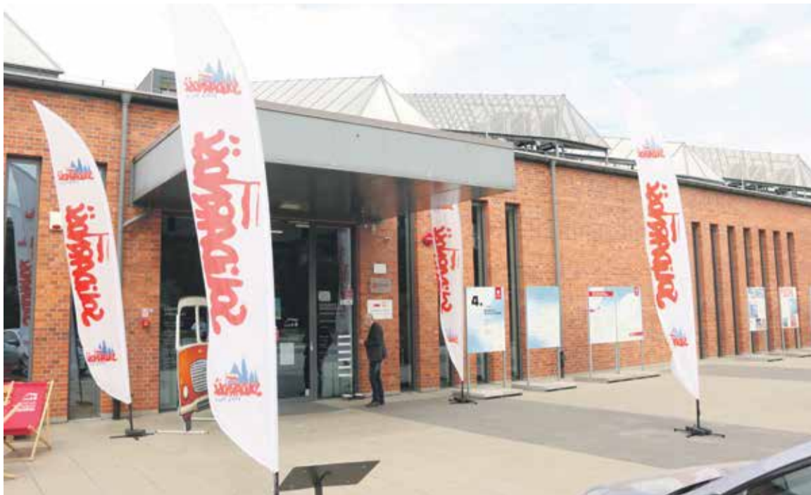
Centrum Historii Zajezdnia – miejsce obrad WZD Regionu

1. Jeżeli w wyniku Porozumienia zawartego przez pracodawcę oraz zakładową organizację związkową lub zakładowe organizacje związkowe – osoby wykonujące pracę zarobkową u tegoż pracodawcy, uzyskały jakiegokolwiek korzyści materialne – osoby te, które jednocześnie nie są członkami związku lub związków zawodowych będących stroną tego Porozumienia – zobowiązane są do uiszczenia na rzecz tego związku lub związków,