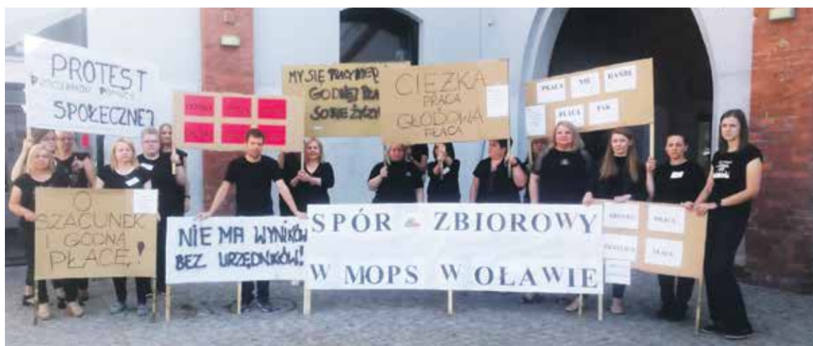
Pikieta pracowników oławskiego MOPS-u