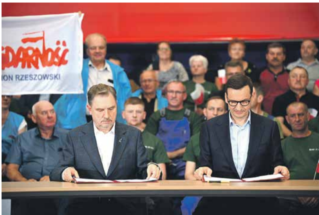
Przewodniczący Piotr Duda i premier Mateusz Morawiecki – sygnatariusze porozumienia

PIOTR DUDA PRZEWODNICZĄCY KOMISJI KRAJOWEJ NSZZ „SOLIDARNOŚĆ”