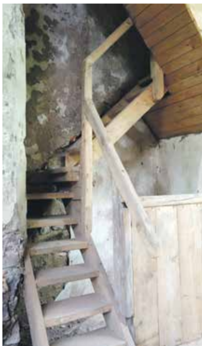
Odtworzone stopnie w dzwonnicy