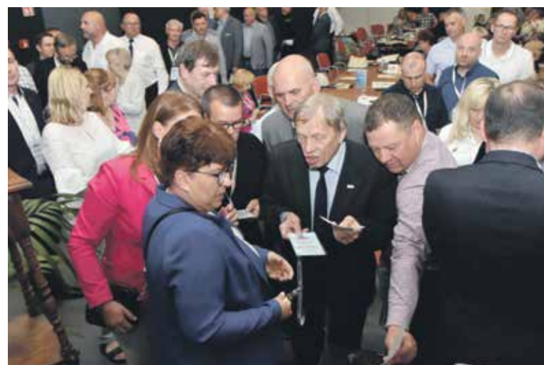
Najważniejszym zadaniem delegatów na WZD był wybór nowych władz związkowych

Zaproszeni goście komplementowali dolnośląską Solidarność. Trochę wspomnień z lat 80. przytoczył wojewoda Obremski. – Wtedy Solidarność próbowała stać na straży godności człowieka i godności słowa. Dziś niech reprezentuje normalność i racjonalność. Wojewoda wskazał również, że związki zawodowe są elementem stabilizującym życie społeczne kraju i tu jest wielkie zadanie dla naszego Związku. Moje pokolenie, ludzi relatywnie