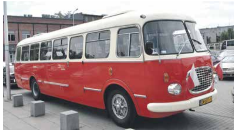
Historyczny zrekonstruowany „ogórek” w CH Zajezdnia

na Grabiszyńską. Pasażerowie entuzjastycznie wyrażali radość z takiej przejażdżki i gromkie skandowanie Solidarność niosło się wieczorową