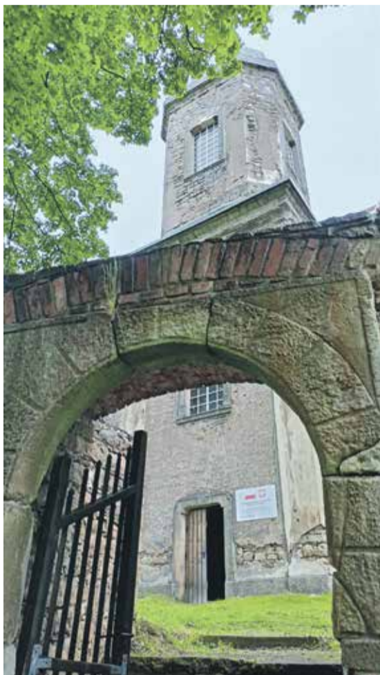
Kościół św. Mateusza w Uniemyślu

Uniemyśl to niewielka, licząca około stu mieszkańców, wioska położona w gminie Lubawka, do niedawna zapomniana przez Boga i ludzi. Blisko stąd do czeskiego Adrspach, znanego z zamku i Skalnego Miasta, Chełmska Śląskiego z domami tkaczy i pocysterskiego opactwa w Krzeszowie. Przed wojną było to znane turystyczne miejsce.