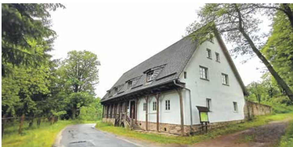
Karczma sądowa z XVIII wieku