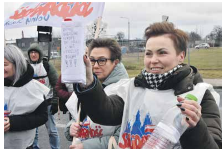
Członkinie Komisji Oddziałowej Simoldes Plasticos

Jako legalnie wybrani reprezentanci załogi zwracamy się do Pana z żądaniem przestrzegania prawa. Taktyka unikania dialogu oraz przedstawiania działań Międzyzakładowej Organizacji Związkowej NSZZ „Solidarność” jako rzekome wtrącanie się w sprawy zakładu Simoldes Plasticos w Jelczu-Laskowicach jest nieskuteczna i spełnia wszelkie znamiona utrudniania