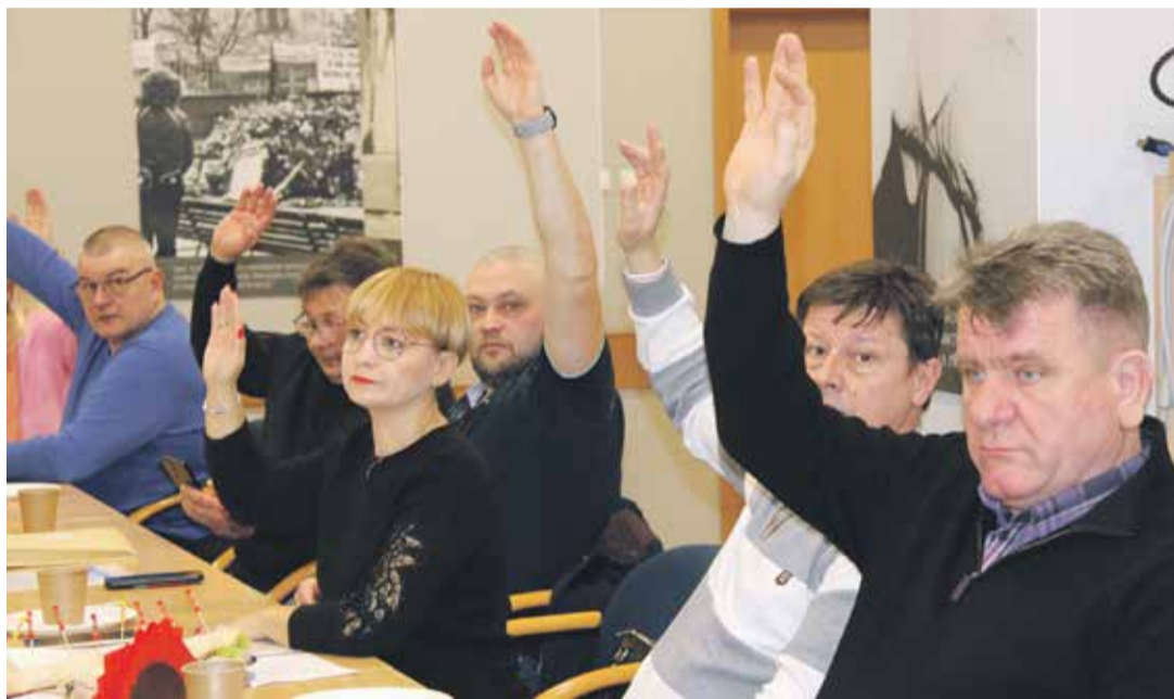
W trakcie obrad przyjęto kilka uchwał wewnątrzwiązkowych.

W styczniu zapadła decyzja o sprzedaży europejskich zakładów firmy Whirlpool tureckiemu Arçelikowi. Arçelik A.Ş. to turecki producent sprzętu AGD. Posiada 30 zakładów produkcyjnych w 9 krajach. Firma jest właścicielem