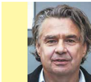
Autor jest reportażystą, felietonistą, powieściopisarzem. Obecnie pracuje w TVP3 Opole i TVP Info.

Nie wyzywam się na młodym aktywiście z Pomorza dla sadyistycznej satysfakcji poniewierania smarkacza, który nawet by nie umiał publicystycznie oddać. Podobnie jak nie kpilem z dziecka, którym do niedawna była Greta Thunberg, gdyż jestem mizoginem w wersji dziecięcej. Nie jestem. I on, i ona służą mi jako przykłady ofiar, którymi ideologia postępu posługuje się, by wysadzić świat z torów. Są mudżahedinami obwiązany dynamitem i posyłanymi między ludzi, by szkodzić. Greta wysadza się na salonach, w komnatach i salach wykładowych. On za to jest członkiem Parlamentu Młodych RP, przewodniczącym Młodzieżowej Rady Powiatu Człuchowskiego oraz posłem Sejmiku