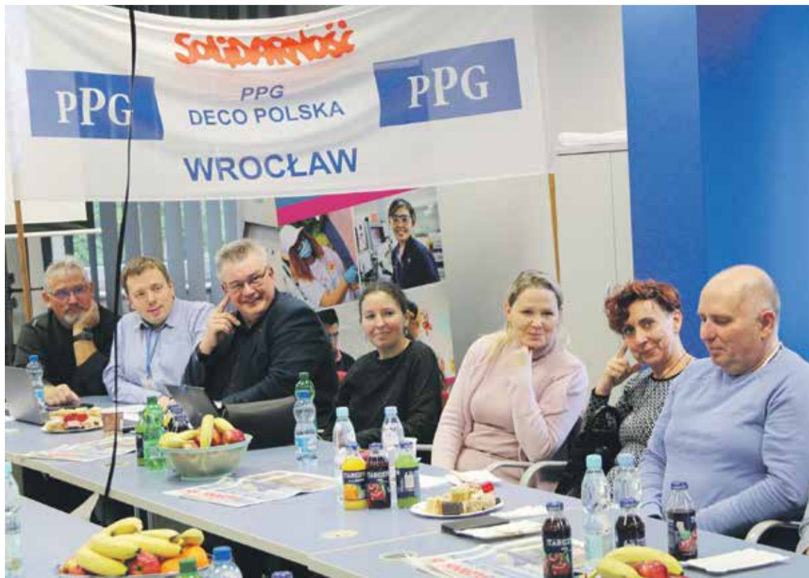
Delegaci podczas zakładowego zebrania wyborczego

Ponadto związkowcy mają zapewniony aktualny dopływ informacji o działaniach koncernu