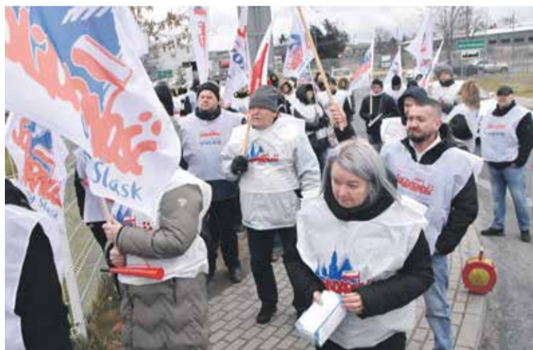
Mimo przenikliwego zimna, przed zakładem zebrano się ok. 150 osób

Zdjęcia i film z pikietki na stronie http://solidarnosc.wroc.pl/chcemy-dialogu-i-godnej-placy/