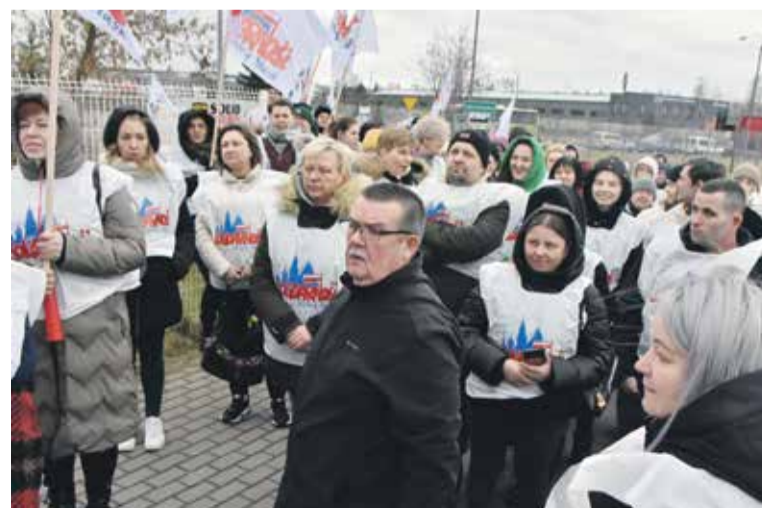
Pod bramą zakładu

Mając tak mocne poparcie załogi, ze spokojem i dobrą wolą oczekujemy, że podejmie Pan decyzję, aby jak najszybciej przedstawiciele zarządu usiedli przy jednym stole z przedstawicielami Związku i w duchu dialogu wypracowali jak najlepsze rozwiązania płacowe korzystne zarówno dla pracowników, jak i przyszłości zakładu.