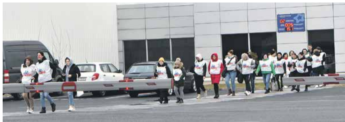
Po zakończeniu zmiany, pracownicy zakładu dołączyli do pikietujących