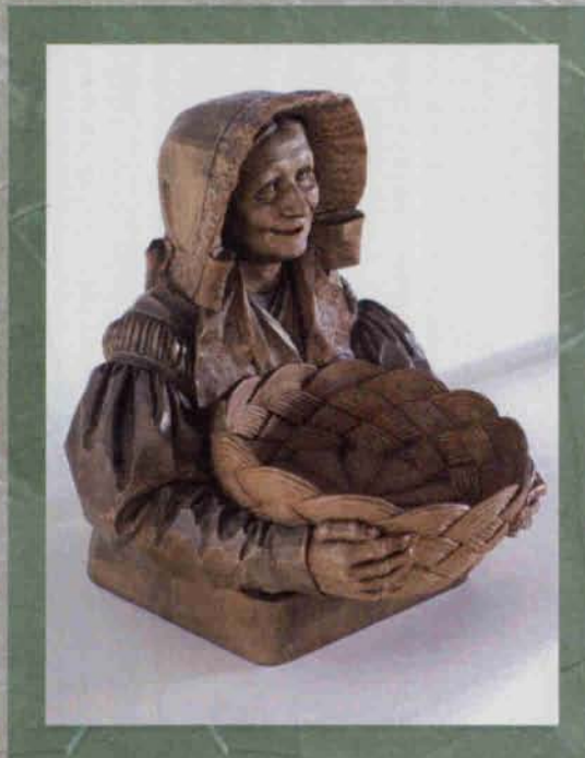
Popiersie starszej kobiety / Muzeum Karkonoskie w Jeleniej Górze

Projekt został zrealizowany dzięki finansowemu wsparciu ze strony Miasta Jelenia Góra, Saksońskiego Ministerstwa Spraw Wewnętrznych i Konsulatu Generalnego RFN we Wrocławiu.