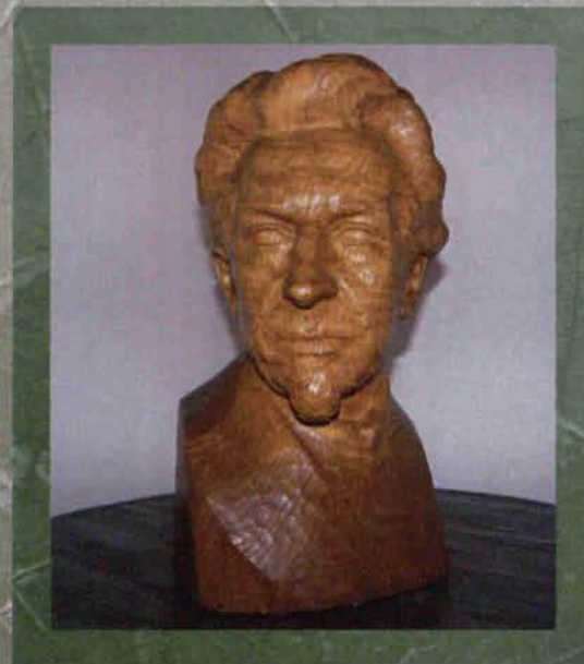
Carl Hauptmann / Muzeum Gerharta Hauptmanna w Erkner / fot. MMDGH