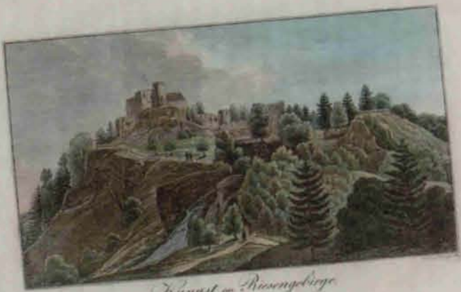
Wyniast im Riesengebirge eine Landschaft im Riesengebirge

OTWARCIE WYSTAWY: 02/02/2019 GODZ. 12.00