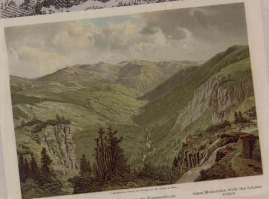
La „Schneekuppe“ dans le Montagne des Géants Schneekuppe im Riesengebirge Giant Mountains with the Schneekuppe