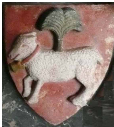
Das Wappen der Familie Schaffgotsch auf dem Grab von Bolko II. († 1368) in der Fürstengruft der Kirche Kloster in Krzeszów (Grüssau)