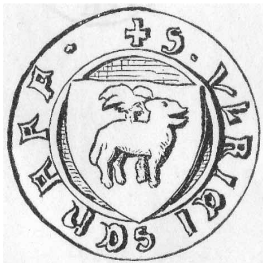
Siegel von Ulrich Schaff um 1350