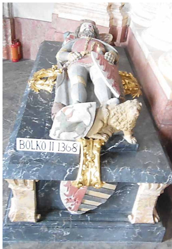
Das Grab von Bolek II. im Mausoleum des Klosters in Krzeszów

Das älteste Wappen der Familie Schaffgotsch