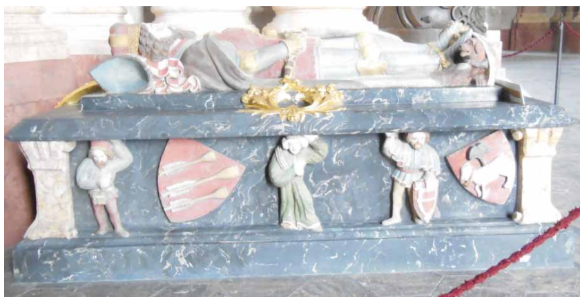
Wappen auf dem Grab von Bolek II.