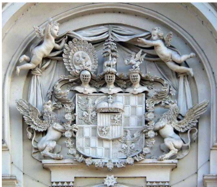
Das Wappen der Familie Schaffgotsch an der Fassade des Schlosses in Cieplice-Zdrój (Bad Warmbrunn) über dem Hauptgebäude Eingang (das Schaf steht unter der Kiefer).