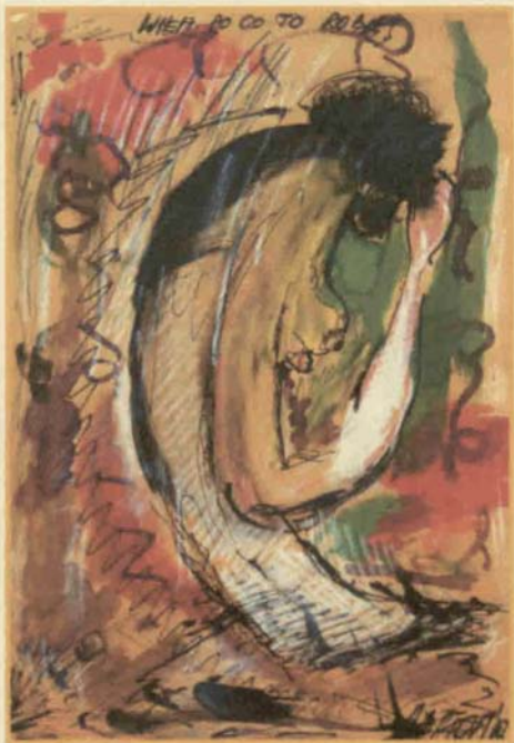
Wiem, po co fo robie - akwarela, tusz patykiem, 2010