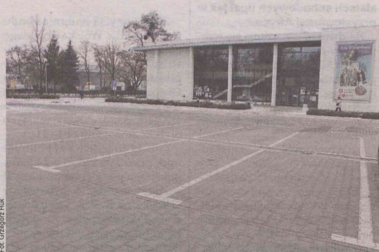
Ten parking jest praktycznie niewykorzystany

Planowany jest dwutygodniowy okres karencji od pobierania opłat dodatkowych na nowych obszarach włączonych do SPP. Na