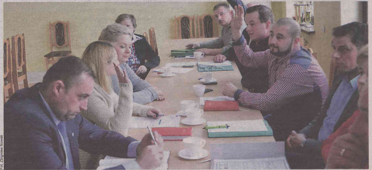
Zajmować się podwyżką czy nie?...