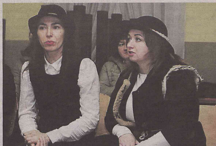
Wieczór kolęd to jedna z form integracji wsi

BOGUSŁAWICE • Wieś coraz aktywniejsza. Jej mieszkańcy grali już wspólnie w siatkówkę, kibicowali swojemu krajanowi, śpiewali kolędy... Teraz najaktywniejsi założyli fundację.