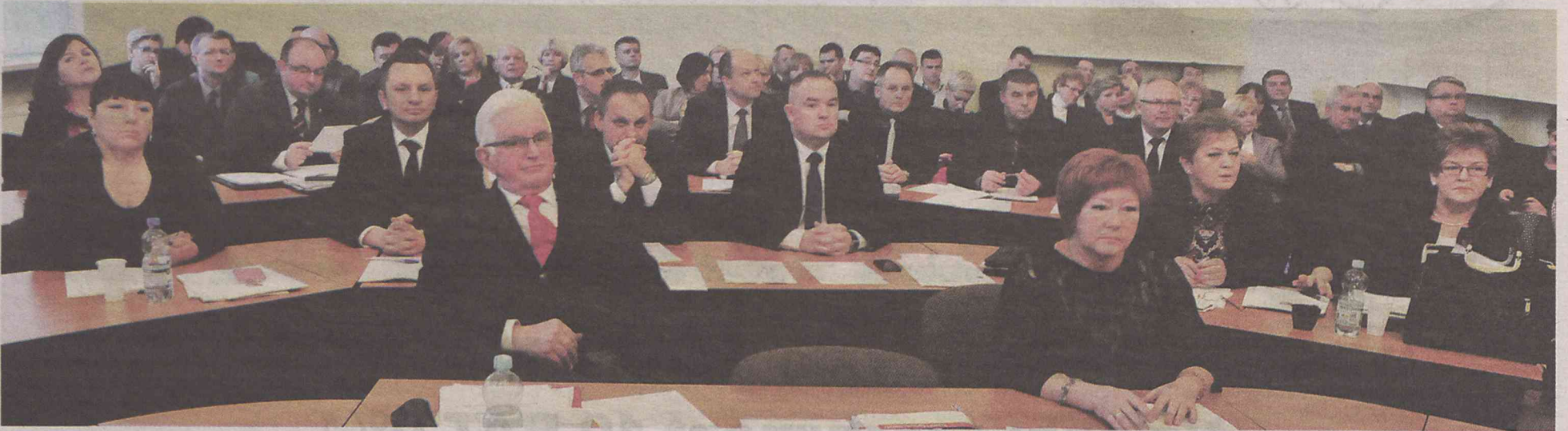
Inicjatorzy referendum nie wszystkich radnych chcieliby widzieć w tej roli...