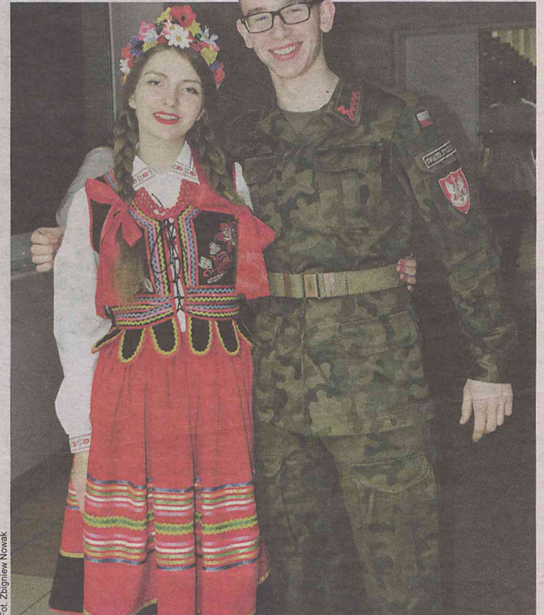
Młodzież też o Kresach nie zapomina

Stanisław Gogacz z senackiej Komisji Spraw Emigracji i Łączności z Polakami za Granicą podkreślał: Ten koncert jest bardzo potrzebny, ponieważ Polacy za wschodnią granicą bardzo czekają na to, że my do nich jakieś sygnały będziemy wysyłać. Ci z nas, którzy mieszkają w naszym kraju, Europie Zachodniej, czy w USA, powinniśmy skrzyknąć się i pomagać rodakom przebywającym tam, gdzie żyje się trudniej. Chciałbym też podziękować mieszkańcom