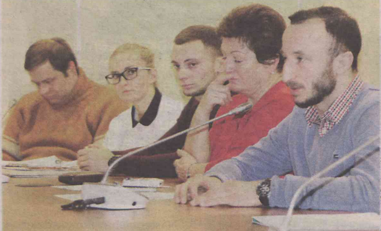
W zebraniu uczestniczyli przedstawiciele 13 organizacji