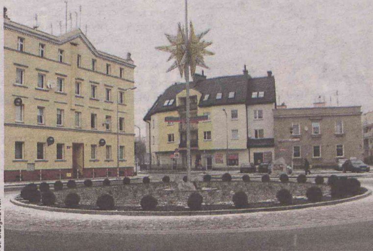
Rondo Żołnierzy Wyklętych już jest

Pilecki to jeden z zapomnianych przez lata PRL-u bohaterów polskiego podziemia podczas II wojny światowej. To chyba jedyny człowiek na świecie, który dobrowolnie dał się uwięzić w obozie koncentracyjnym w Oświęcimiu, aby tam zorganizować ruch oporu. Auschwitz przeżył, ale Polski Ludowej nie. Został aresztowany przez Urząd Bezpieczeństwa. W trakcie ostatniego, jak się później okazało, widzenia z żoną, wyznał jej w kontekście okrutnych przesłuchań i traktowania: „Oświęcim to była igraszka...”. Zamordowany strzałem w tył głowy w więzieniu na Rakowieckiej w Warszawie został pogrzebany przez komunistycznych oprawców w zbiorowej mogile w dzisiejszej kwaterze „L” („Łączka”) Cmentarza Wojskowego na Powązkach. W publikacji „Sześć twarzy odwagi” historyk brytyjski M. Foot zaliczył Pileckiego do 6 najodważniejszych lu-