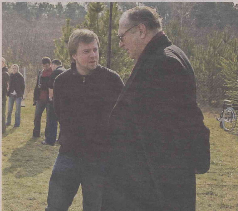
Na planie z Krzysztofem Zanussim