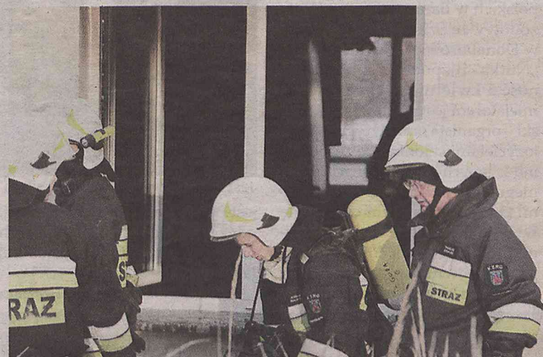
Lokatora nie udało się uratować