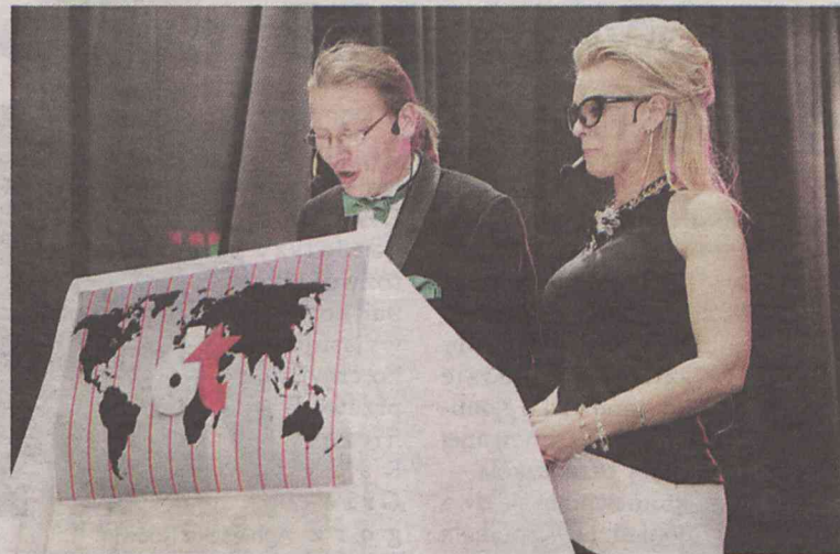
Właśnie leci „Dziennik Telewizyjny”