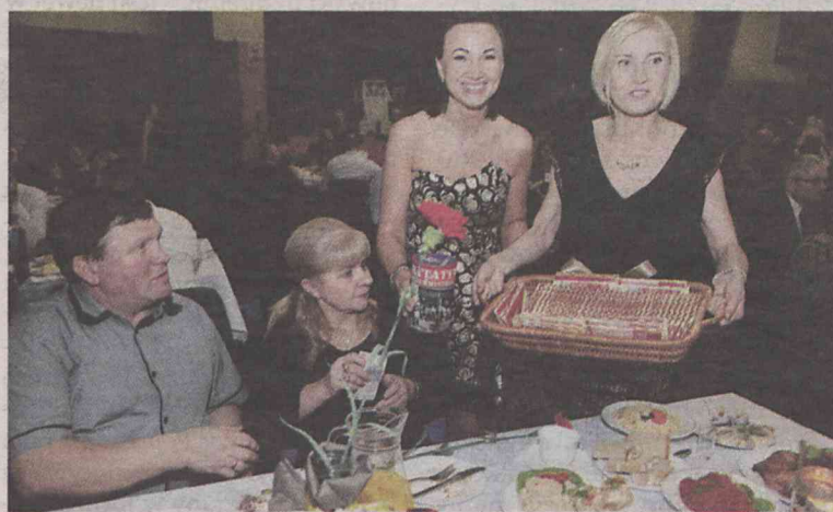
Ile kosztuje „Jedyna”?