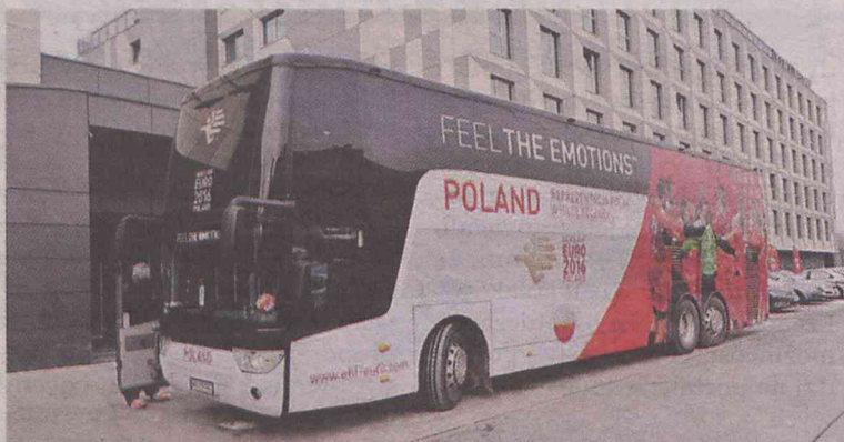
Autobus kadry oklejony przez firmę ze Smardzowa