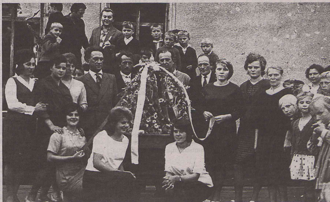
Szkolna społeczność sprzed lat na dożynkach