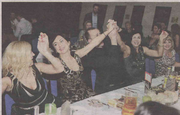
Przy stole trudno było usiedzieć...