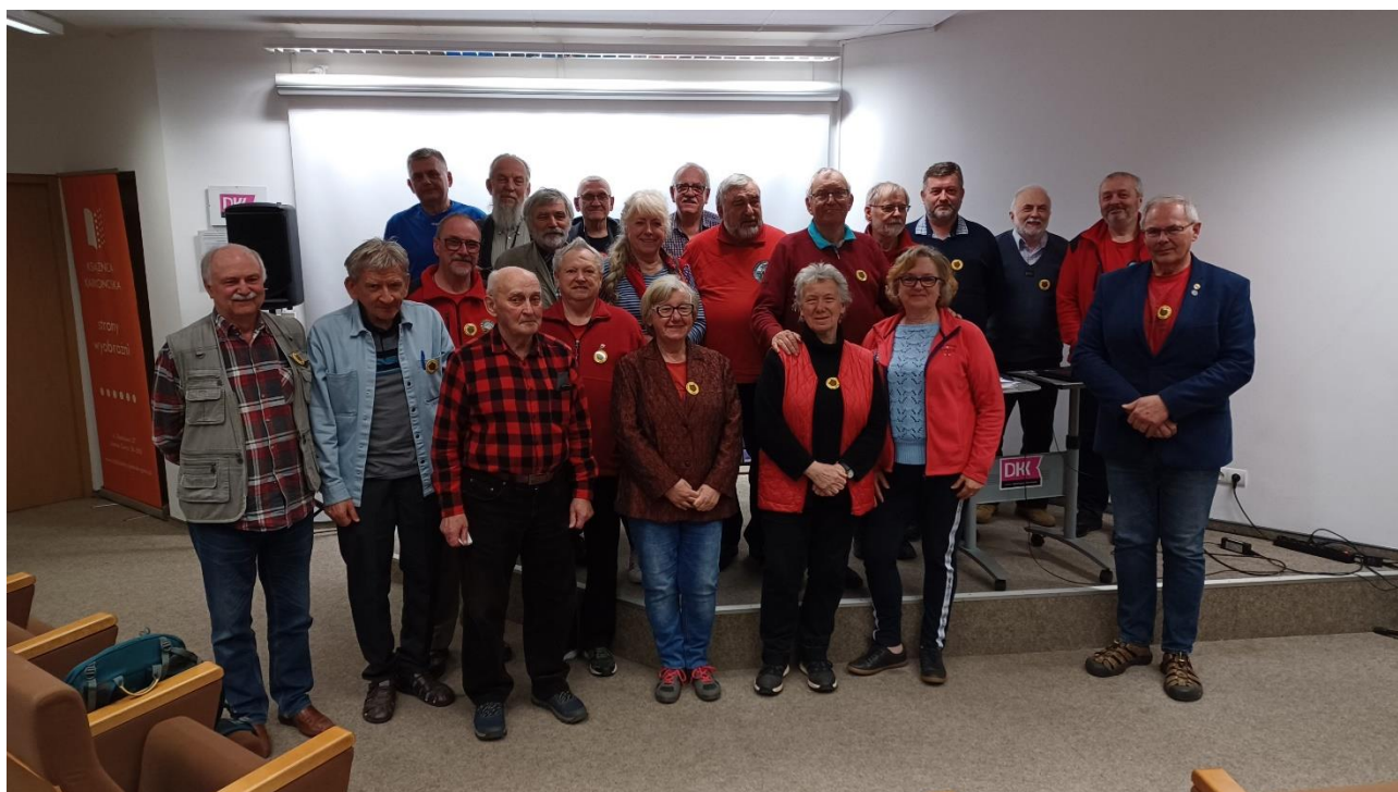
Uczestnicy spotkania.

Kolekcja szkła również wzbudziła wyjątkowe uczucia wśród zwiedzających. Czasami nie chce się wierzyć, że tak wyjątkowe przedmioty może wykonać człowiek.