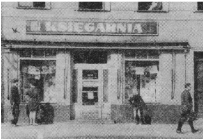
Obecnie w tym miejscu znajduje się kawiarnia „Forum”

ników, lodów i innych wyrobów cukierniczych wytwarza się tu także galanterię czekoladową. Ogólna ilość wyprodukowanych w tym roku wyrobów spółdzielni cukierniczej wyniesie około 9,5 mln. zł.